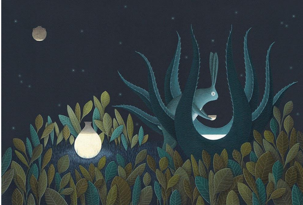
Figura II. El conejo llena su cántaro.