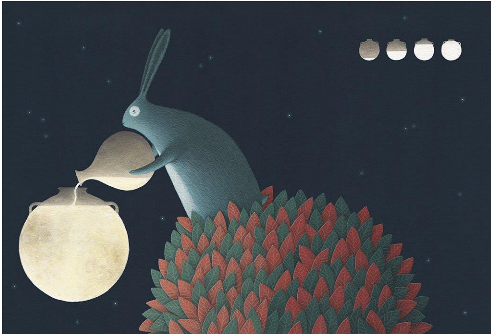
Figura III. El conejo vacía el pulque en una olla.

Fuente: Álvarez, David. “Noche antigua.” David Álvarez: enero 2018 , 6 de enero de 2018, Blogspot. http://david-alvarez.blogspot.com/2018/01/