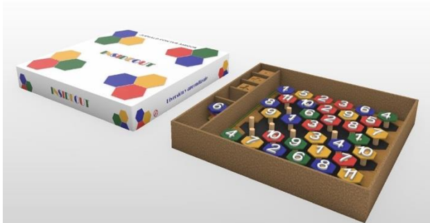
Imagen 4. Propuesta final y empaque. Autoría propia. Obtenida el 26/04/2022

Se incluye un pequeño manual donde se informa al usuario la forma básica a usar la herramienta, de qué trata, quiénes pueden jugarlos, como limpiarlo y su debido cuidado. Todo lo mencionado está representado gráficamente con un pequeño texto para una mejor comprensión para los niños y el adulto supervisor.