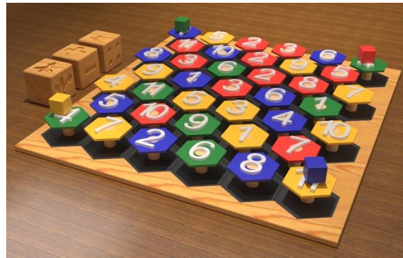
Imagen 1. Material Autodidáctico.

La propuesta final del proyecto consiste en la revitalización de la experiencia educativa durante el desarrollo cognitivo, en niños de 7 a 11 años, mediante una herramienta de aprendizaje la cual por medio de la observación se busca reforzar el conocimiento de la aritmética, siendo un medio por el cual se relacionan los conocimientos viejos con los nuevos.