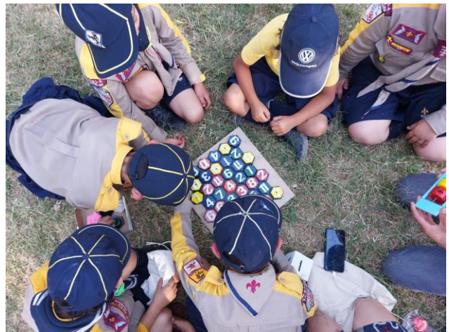
Imagen 8. Validación con scouts

La segunda se realizó con los mismos niños que las entrevistas pasadas, esta etapa fluyó con mayor facilidad, ya que consistió en el uso del material didáctico, el cual desató interés y entusiasmo por parte de los infantes, para conocer de qué trata el proyecto, al igual que el objetivo que tiene, una vez que se les platicaron las reglas se comenzó con la primera ronda, se observó una sana competitividad entre amigos por querer decir todos los resultados de cada operación, para así poder ganar el mayor número de fichas.