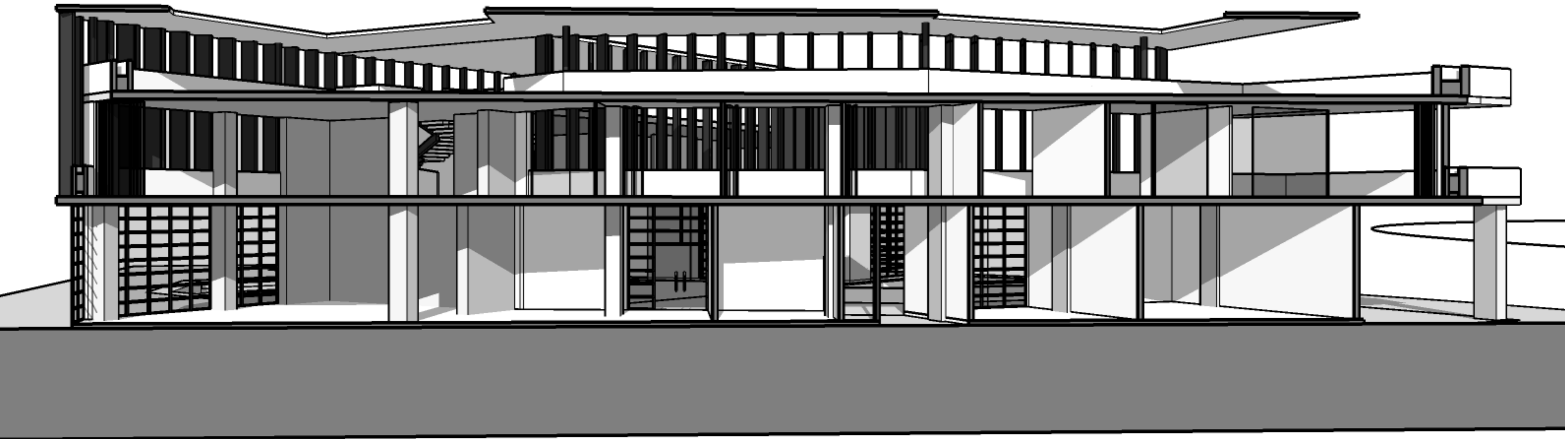
CORTE X, X'