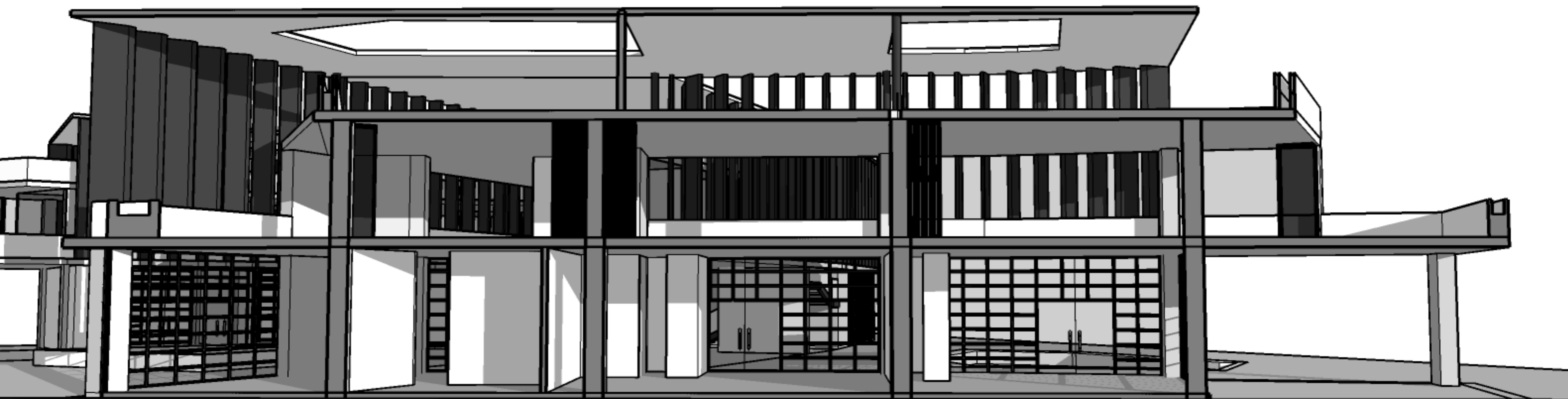
CORTE Y, Y'