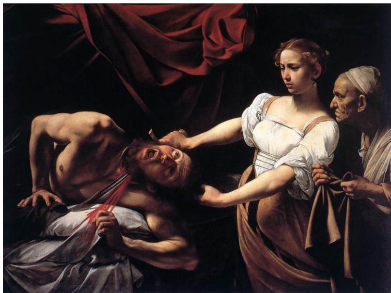
Fig. 4 Judit cortando la cabeza de Holofernes , por Merisi Caravaggio

De nuevo está allí el realismo de Enrigue, y esto se ve en tres aspectos, cuando dice que la mujer tiene un gesto más sexual que vengativo, que está caliente (es decir excitada), y que el semen del hombre todavía escurre por la cara interior de sus muslos. Lo que ha hecho Enrigue es resignificar al objeto representado, convirtiéndolo en un texto signifiante, en ese otro del texto verbal. La ecfrosis de Judit cortando la cabeza de Holofernes hace que resignifiquemos el texto de la descripción en base a los detalles ofrecidos por el autor.