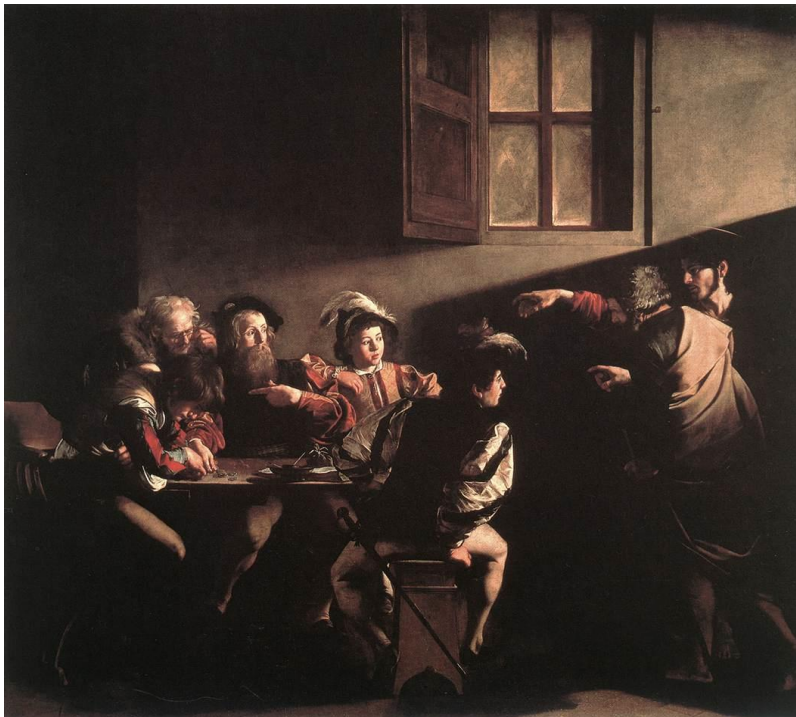
Fig. 5 La vocación de San Mateo , por Merisi Caravaggio

Como en casi todas las pinturas posteriores de Caravaggio, en La vocación la mayor parte de la superficie del cuadro está vacía. Una habitación oscura cuyos muros negros –que debieron ser los de su estudio– apenas se interrumpen en una ventana cuyos vidrios han sido opacados. La única fuente de luz no aparece dentro del cuadro: es una claraboya apenas abierta por arriba de la cabeza de los actores. Pedro y el Mesías, casi en tinieblas, señalan al cobrador de impuestos, que los mira sorprendido en compañía de cuatro compinches vestidos lujosamente y ocupados en contar monedas con una atención pecaminosa. Los trajes de Jesús y su pescador son tradicionales: mantones bíblicos. Los recaudadores de impuestos, en cambio, están sentados y vestidos como se debieron haber vestido y sentado los prestamistas de Giustiniani 5 en la parte baja de su palacio, abierta a los clientes que utilizaban las mesas de cambio. (Enrique 52)