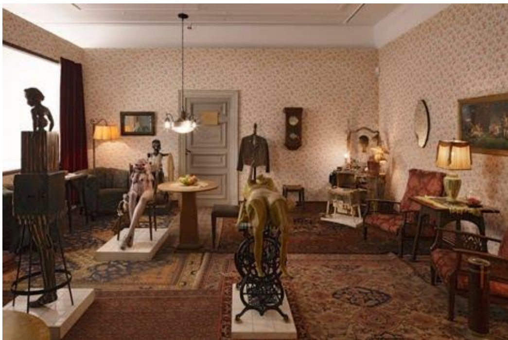
Fig. 2 Roxy's , de Edward Kienholz, 1961

La simultaneidad en lo descrito se complementa con un poco de vivacidad expresiva otorgada por la manera en que el narrador describe la iluminación. Asimismo, la descripción de los objetos hace que la instalación parezca estática, sin dinamismo, puesto que una instalación real siempre es inmóvil, para ser contemplada por los espectadores.