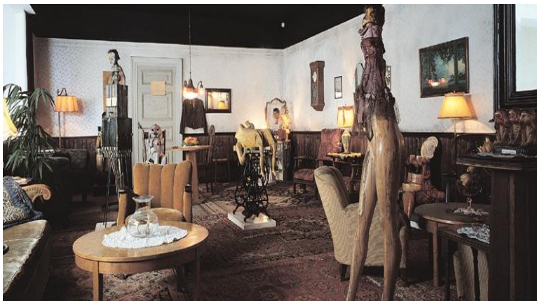
Fig. 1 Roxy's , de Edward Kienholz, 1961

A partir del referente real que es Roxy's , la descripción de La sala de mi abuela representa –término indispensable en la ecfrasis– ciertos objetos de esa instalación (las lámparas de mesa, la sala, la atmósfera iluminada y el sillón). Recordemos la aseveración de Pimentel de que al momento de describir el novelista puede seleccionar y resignificar los objetos representados.