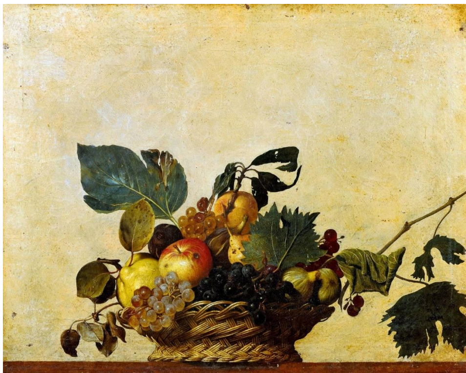
Fig. 3 La canasta de frutas , por Merisi Caravaggio

En lugar de representar una ventana con escorzo hacia el exterior como tendía a hacer el realismo óptico renacentista, ocupaba un espacio tridimensional interior: se veía como si fuera un cesto en una repisa. Para aumentar el efecto, Caravaggio pintó el fondo del cuadro del mismo color que la pared del estudio del cardenal Borromeo en el Palazzo Giustiniani y hasta siguió las pequeñas cuarteaduras y abultamientos de humedad en el muro en que fue colgado. Si no el cuadro completo, al menos su fondo tuvo que ser hecho in situ. Pintar las frutas al borde de la pudrición no le debe haber tomado a Caravaggio más de dos días. (Enrique 19)