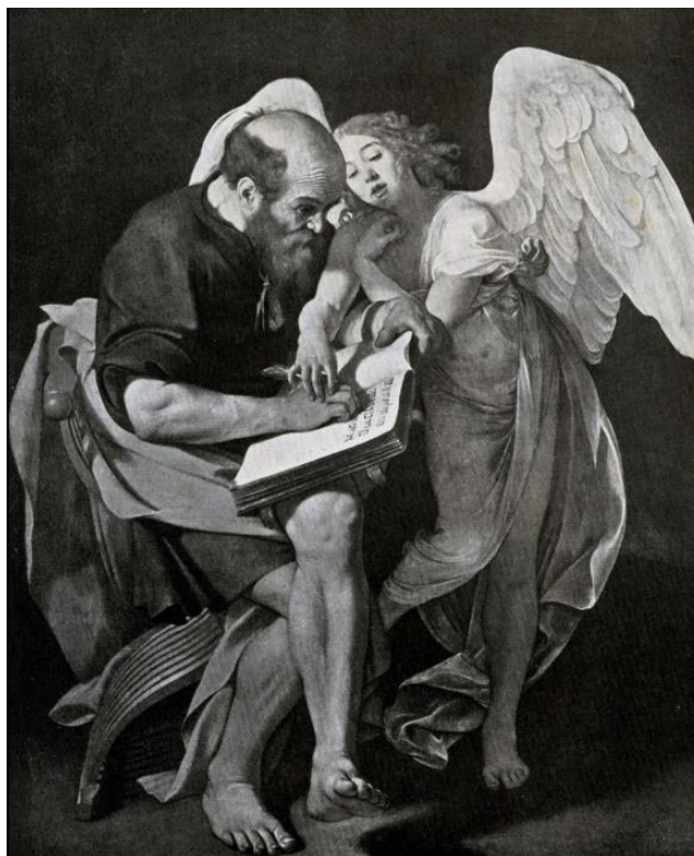
Fig. 7 San Mateo y el ángel , por Merisi Caravaggio

Según Verónica Maristain, la literatura de Enrigue tiene “[...] una frescura y un tono personal que le permite transitar por una ruta propia, no original ni rotundamente nueva, sino suya, de él.” (Maristain párr. 1). Con Muerte súbita y sus ecfasis el autor se mueve más en interpretaciones propias y un realismo muy propio. Como afirma Pimentel, el texto actúa como una especie de guía que orienta la percepción del objeto descrito. Sobre todo en el cuadro Judit cortando la cabeza de Holofernes , Enrigue agregó detalles de su autoría: los pezones que casi revientan la camisa de Judit y su gesto de placer. En el tercer capítulo veremos la importancia del erotismo en el ethos barroco.