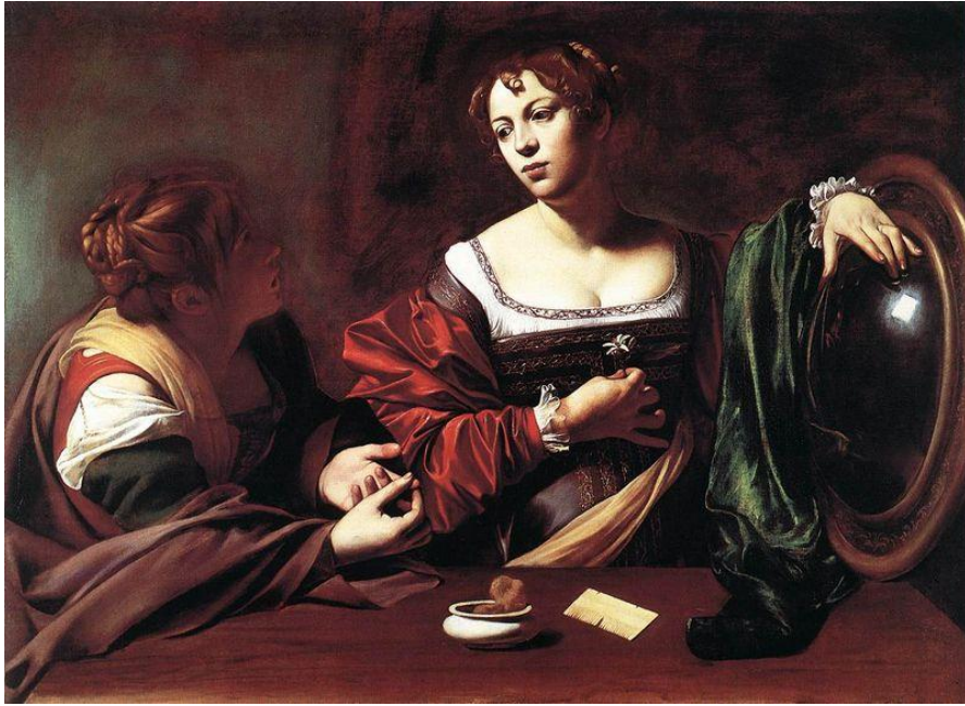
Fig. 6 Marta y María Magdalena , por Merisi Caravaggio

En la quinta ecfrasis del cuadro San Mateo y el ángel (del que se conserva sólo una fotografía en blanco y negro al haberse destruido el cuadro original) el dinamismo se nota: “[...] en él, el santo fue representado como un mendigo perplejo; un serafín le guía la mano con que escribe el Evangelio.” (Enrigue 62). En San Mateo y el ángel Enrigue de nuevo introduce su realismo al describir al personaje como un mendigo, pues el cuadro más bien ofrece una idealización de San Mateo.