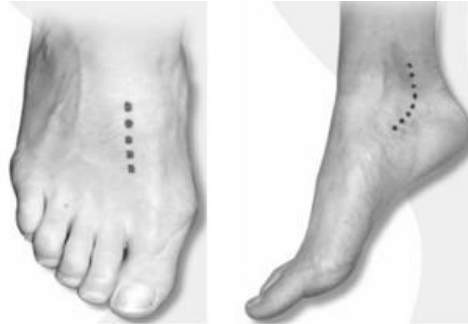
Figura 3. Las líneas punteadas indican la posición de las arterias pedia y tibial posterior (13)

El índice tobillo-brazo (ITB) es un tamizaje basado en la palpación de los pulsos pedios y tibiales posteriores, debe ser realizado en las personas mayores de 50 años o menores de 50 años con factores de riesgo o más de 10 años de enfermedad. Si es normal se debería repetir cada 5 años. (19) (20)