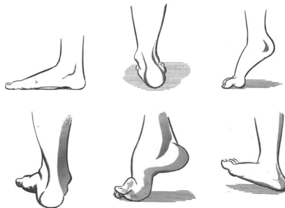
Figura 2. Las deformidades que deben ser investigadas en el examen de los pies (16)

El examen de los zapatos es importante para saber si estos son adecuados, generalmente se usan zapatos en punta con tacón o diferente talla o número. Se deben buscar sitios de apoyo y puntos de presión inadecuados; revisar sobre la presencia de cuerpos extraños en el zapato (arenillas o piedrecitas). Se debe sospechar EAP si hay cianosis, disminución de la temperatura de la piel, uñas hipertróficas y por otro lado relleno capilar lento. La evaluación de los pulsos