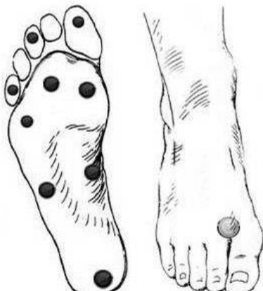
Figura 4. Áreas para la utilización del monofilamento 10 g. (21)

En la actualidad, para el diagnóstico de neuropatía diabética pueden ser usados scores compuestos en las Guías NeurALAD o distintos exámenes con verificación previa. (21) (22) (23)