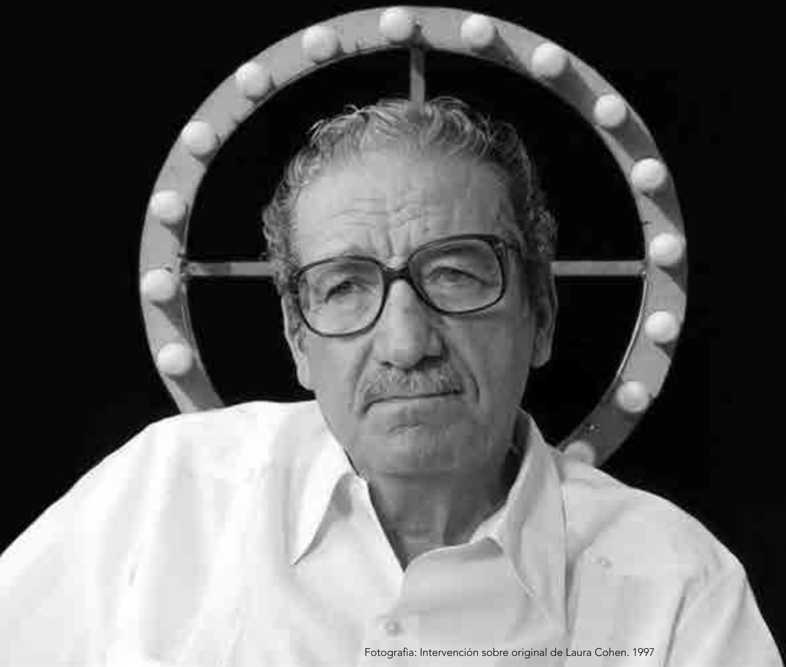
Fotografía: Intervención sobre original de Laura Cohen. 1997