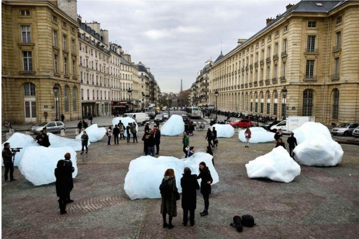
Imágen de: Olafur Eliasson