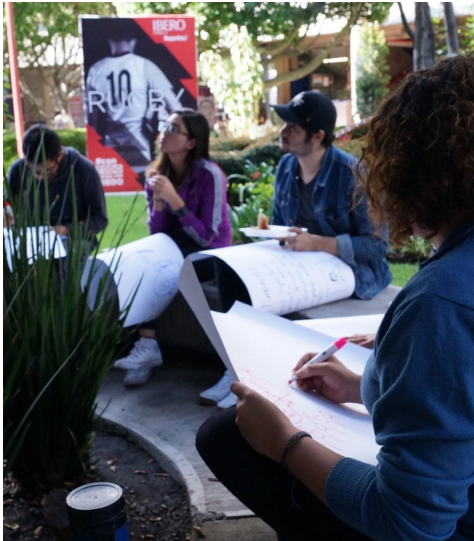
Fig 2. Imagen de las personas plasmando sus ideas en papel

La actividad consistió en consultar a las personas sobre momentos de su vida en los que habían tenido problemas emocionales y cómo lidiaron con ellos. Posteriormente se les pidió plasmar una idea, la cual no tenía restricciones respecto a si era posible hacerla o no, que les hubiera ayudado en ese problema.