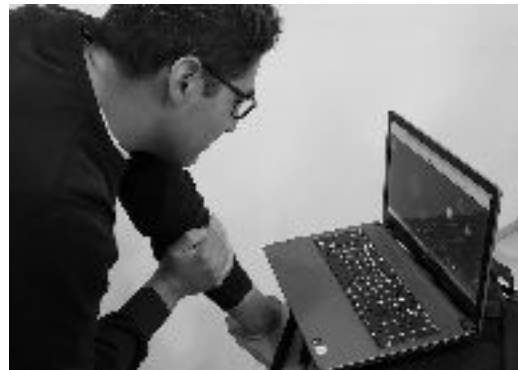
Fig 8. Foto de un usuario probando a Rob Bot

(importante mencionar que sí lo tuvo en algunos casos), lo tuvo en otros ámbitos, el más destacable de estos siendo la autorreflexión que causó (según la respuesta de los usuarios mismos a una serie de preguntas realizadas después de la experiencia con el diseño). De igual forma, mostró tener buen desempeño en cuanto a su transmisión vía redes sociales, lo que se midió por la cantidad de personas que hacían click en el botón de compartir que la página tiene. Por otro lado, para tener alguna referencia de qué tan efectivo era Rob Bot a la hora de llevar a la gente al psicólogo, se usó la cantidad de descargas de un cupón de descuento a la primera cita con un terapeuta, el cual se obtiene al terminar la experiencia con Rob Bot (todo esto sigue siendo hipotético, pues aún no se ha realizado ningún convenio con instituciones médicas o terapeutas particulares).