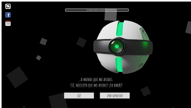
Fig 7. Vista final de Rob Bot 2.22 en el servidor