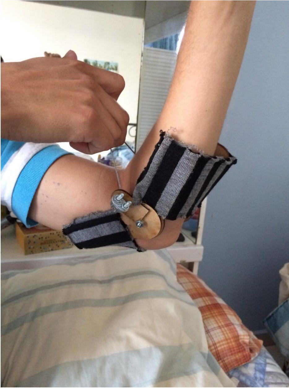
Figura 3. Prueba experimental al prototipo.