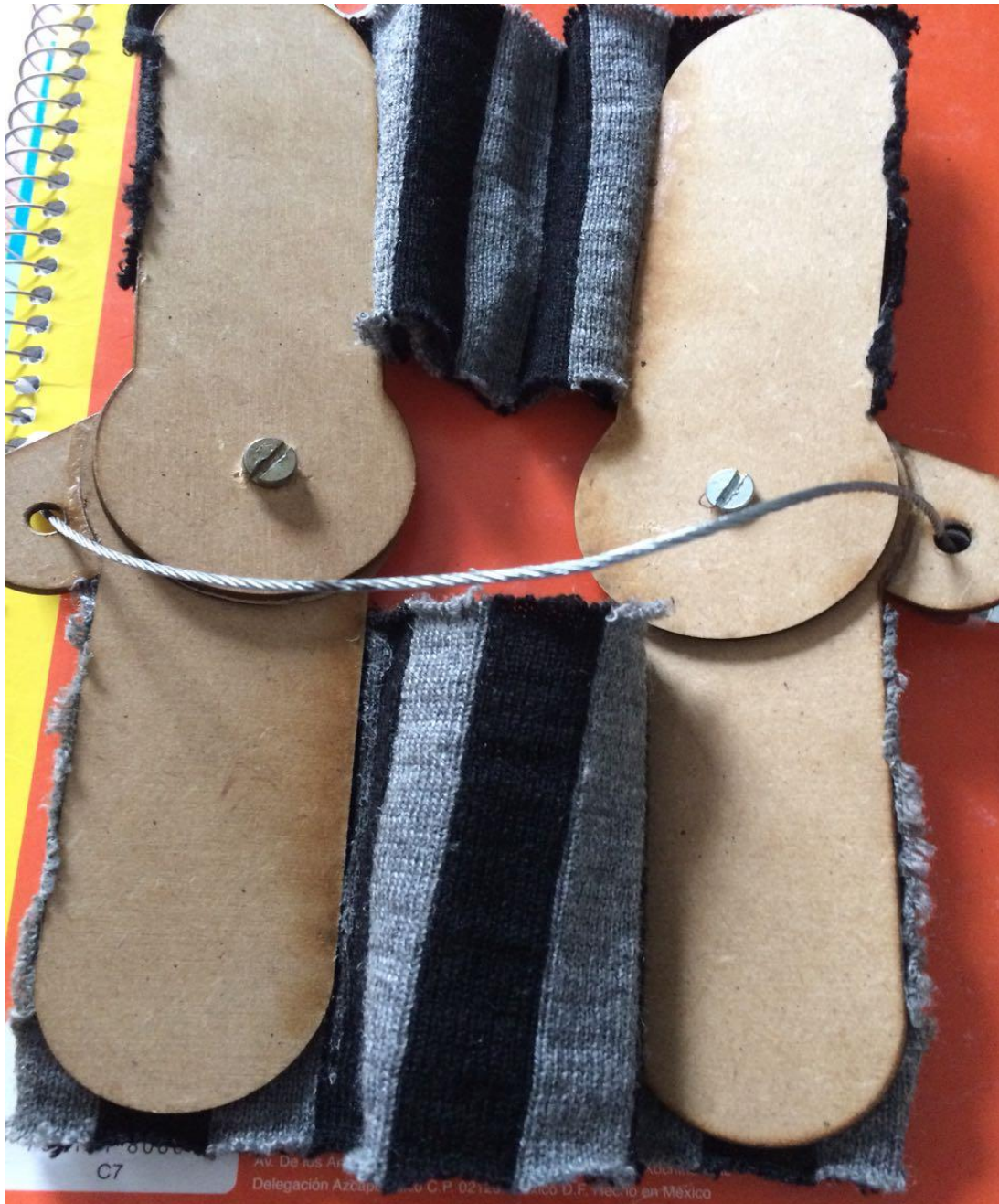
Figura 2. Componentes de la primera maqueta del prototipo del soporte braquial.