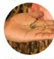
• Se sopla la cáscara que queda de la vaina