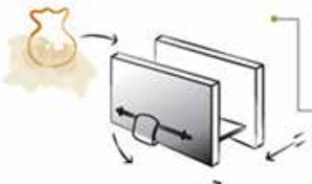
• Una vez envuelta la masa en la tela se coloca entre las placas de la prensa.