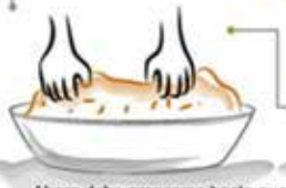
Ahora debe amasarse hasta que sea evidente el aceite en las manos.