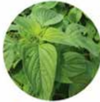
• Cultivo de chía