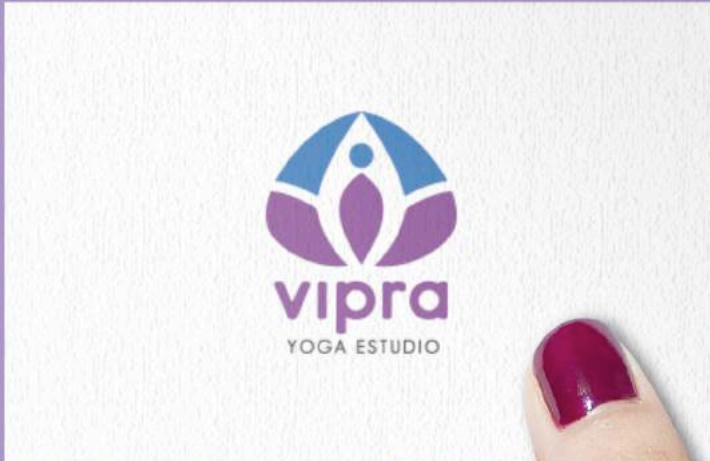
Vipra Yoga, logotipo