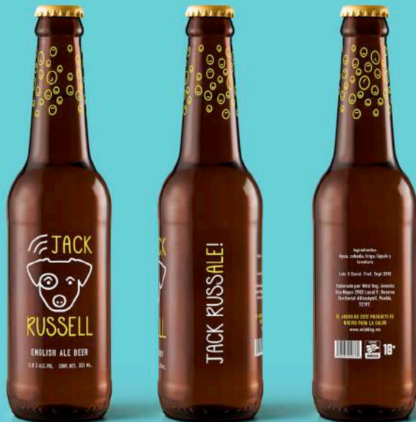
Wild Dog beer, branding & packaging