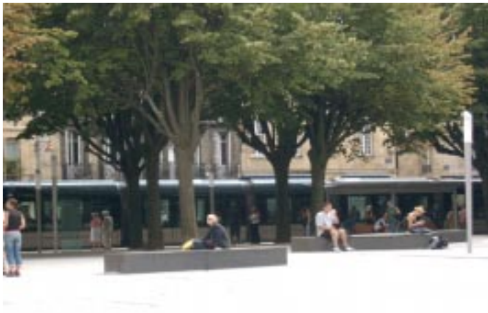
Burdeos 2004. El nuevo tren-tranvía urbano es el argumento central de la regeneración urbana.