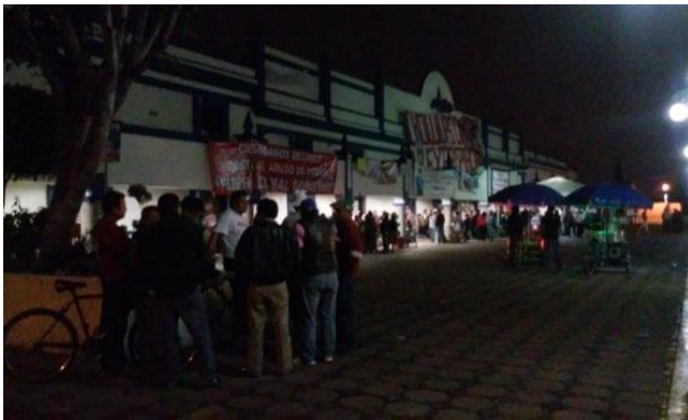
Ilustración 21. Mujeres, niños y ancianos pasan la noche en el portal del palacio municipal el día de la toma. Gabriela Di Lauro.

Regresé a casa casi a media noche, apagué el teléfono y me fui a dormir con la certeza de que al día siguiente, después de dejar a mi hijo en el colegio, alcanzaría a los compas en el plantón. No fue así.