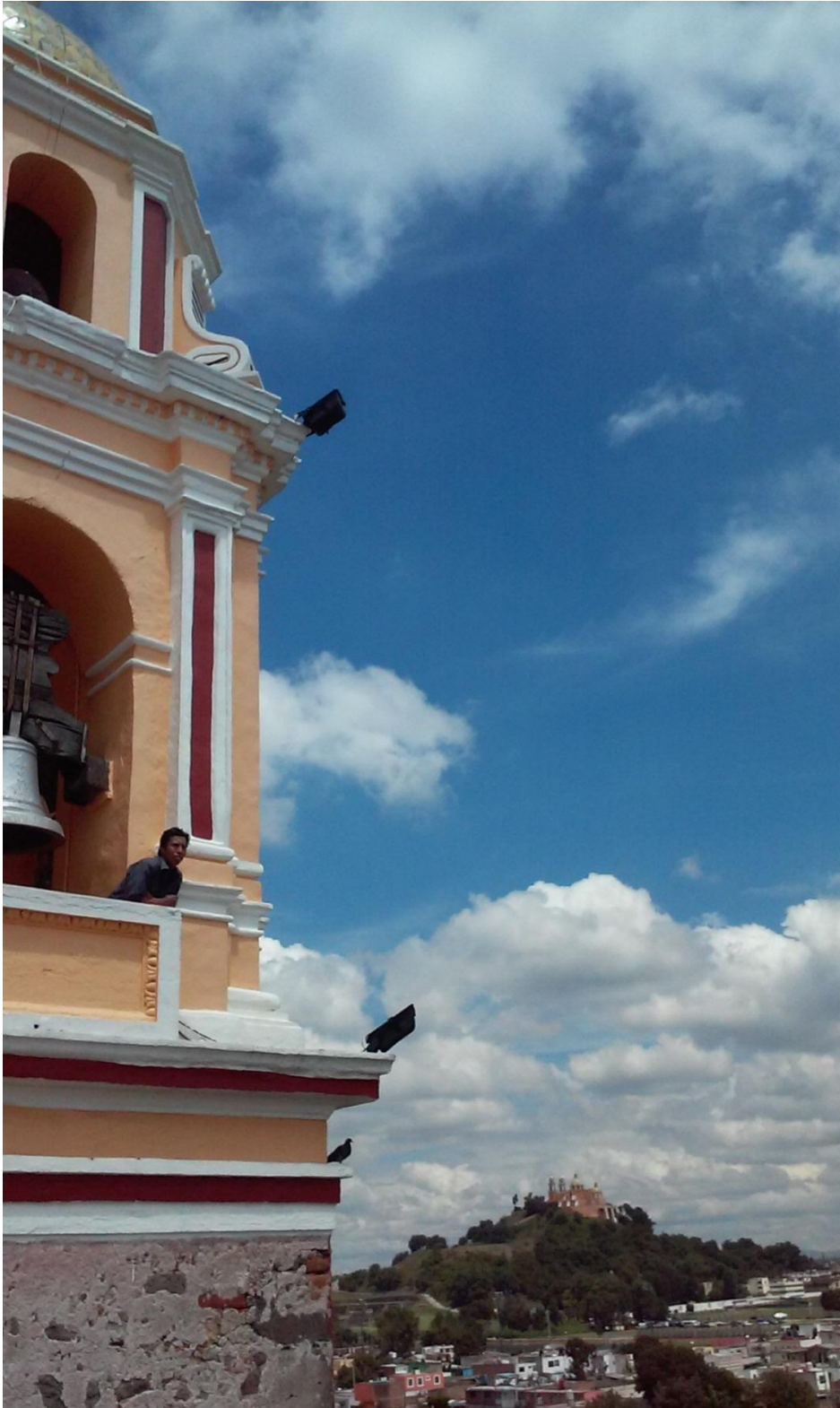
Ilustración 11. Campanario de la parroquia de San Andrés Cholula la mañana del 9 de septiembre de 2014 cuando el repique de campanas llamó a los pobladores a congregarse frente al palacio municipal de San Andrés. Gabriela Di Lauro.