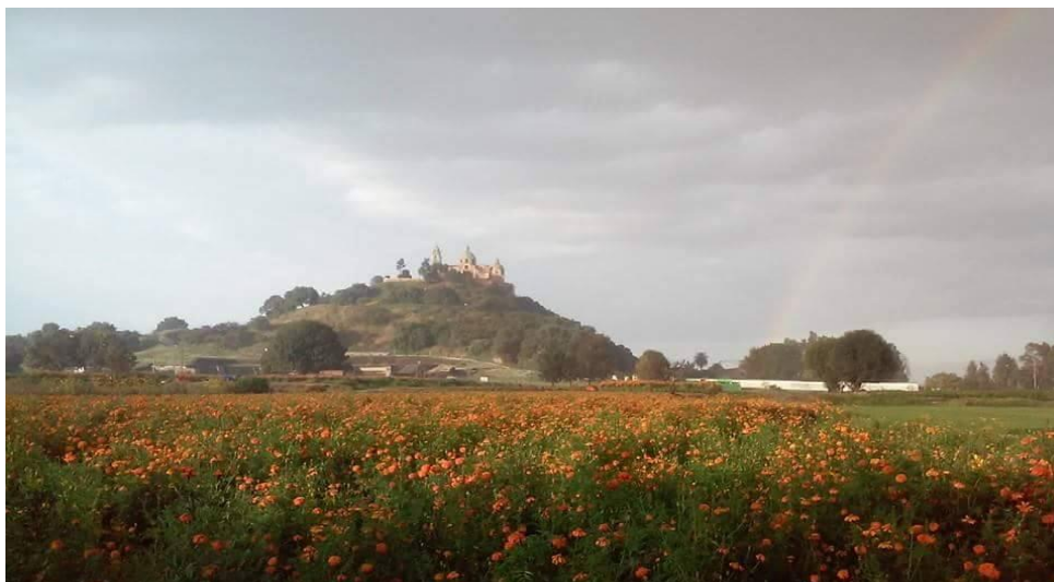
Ilustración 1. Paisaje cholulteca con flor de muerto. En septiembre se siembran las plántulas de cempaxúchil y en noviembre se cortan para las tradicionales ofrendas de muertos. Gabriela Di Lauro.

Eso sentí, que me quitaban algo. No soy cholulteca, pero desde que llegué en el 2000 me adueñé del gentilicio en una especie de mecanismo personal para hacerme de una identidad que no sentía entre la disputa de ser poblana o ser chilanga. Así, “bien cholulteca yo” decía cuando me preguntaban de dónde soy.