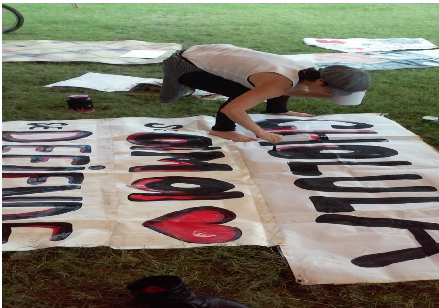
Ilustración 17 Cholula se ama y se defiende. Manta elaborada por asistentes al Foro del 8 de septiembre como parte de las actividades de manifestación pacífica.