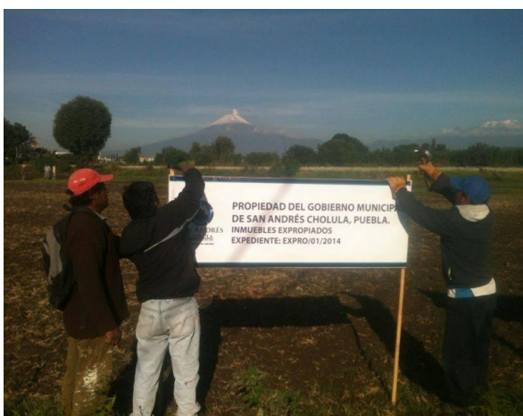
Ilustración 8. Terreno propiedad del gobierno de San Andrés Cholula. La mañana del 26 de agosto autoridades municipales se presentaron en los predios para colocar avisos que señalan que el terreno es propiedad del gobierno municipal de San Andrés Cholula.

En el entendido, entonces, de que lo que debíamos hacer era organizarnos y diseñar una estrategia, pero aún sin saber muy bien cómo ni cuándo, amanecimos los san andreseños y el Círculo el martes 26 de agosto con el llamado a defender a los campesinos dueños de los terrenos porque había llegado la autoridad municipal a colocar mallas y letreros indicando que esos terrenos eran ahora propiedad del gobierno.