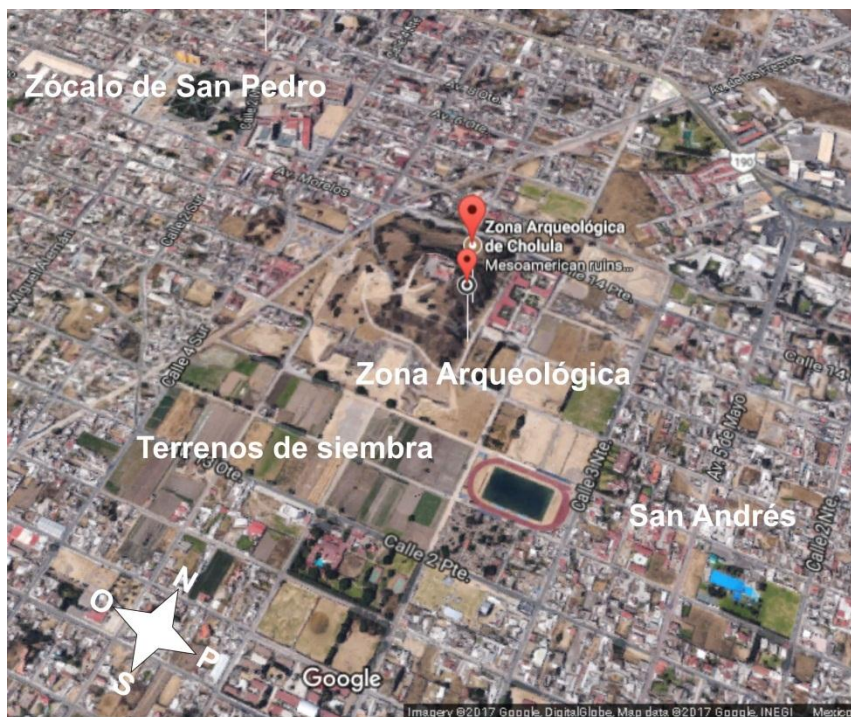
Ilustración 2. Mapa de San Pedro y San Andrés Cholula.

Se tiene evidencia de que “el Popocatépetl tuvo una gran erupción que cubrió Tetimpa y Coapan en la segunda mitad del primer siglo de nuestra era y Cholula acogió a la gente que buscaba un sitio en incipiente crecimiento” (Uruñuela, 2006). Su importancia como centro ceremonial y su trágica historia en el proceso de conquista, imprimieron en su desarrollo características especiales que, tras la división geopolítica en tres municipios, desvinculó a sus habitantes.