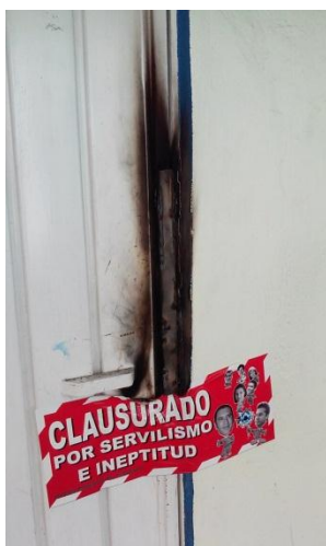
Ilustración 19. Puertas de la presidencia municipal de San Andrés soldadas. Los habitantes de Tlaxcalancingo llegaron con herramientas para soldar las puertas de la presidencia clausurando las entradas. Los funcionarios ya habían evacuado el edificio previamente. Gabriela Di Lauro.

la idea que yo tenía, pero cuando le digo a K, oye, pero por qué están haciendo... “pues tú no estuviste y ya las comisiones ya están todos los acuerdos y ya está”. Así como que los dejó. Y chin, cuando veo uno corre por allá, otro corre para acá y así. Nunca vi los pegotes, no sé si se acordó las frases de las ratas y todo (...)