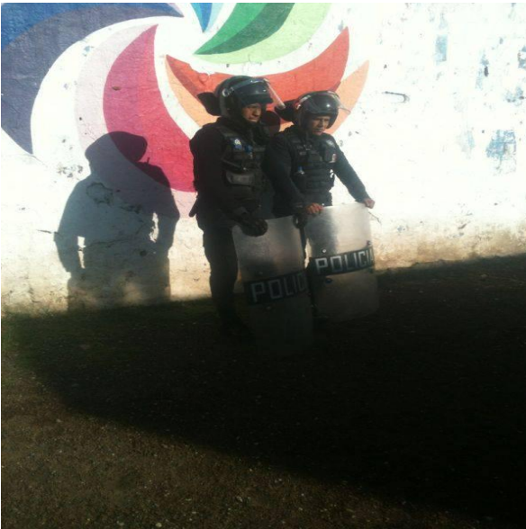
Ilustración 9. Granaderos de la policía durante la colocación de mallas ciclónicas en los terrenos de San Andrés. Víctor Blanco.

aquí no va a ser la conferencia, va a ser allá, vámonos” Y ahí nos fuimos como cuarenta, cincuenta que estábamos ahí, nos fuimos atravesando los terrenos y fue en la ocho, en esa parte donde estaban los campos deportivos, y ahí estaban los policías (Adán, 2016).