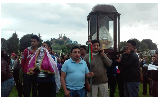
Ilustración 14. La imagen de la Virgen en los terrenos que serían expropiados para la construcción del parque intermunicipal.

Adán dice que el haberlo hecho así “dio confianza a los de San Pedro” para que se convencieran y se pudiera realizar la del 3 de octubre.