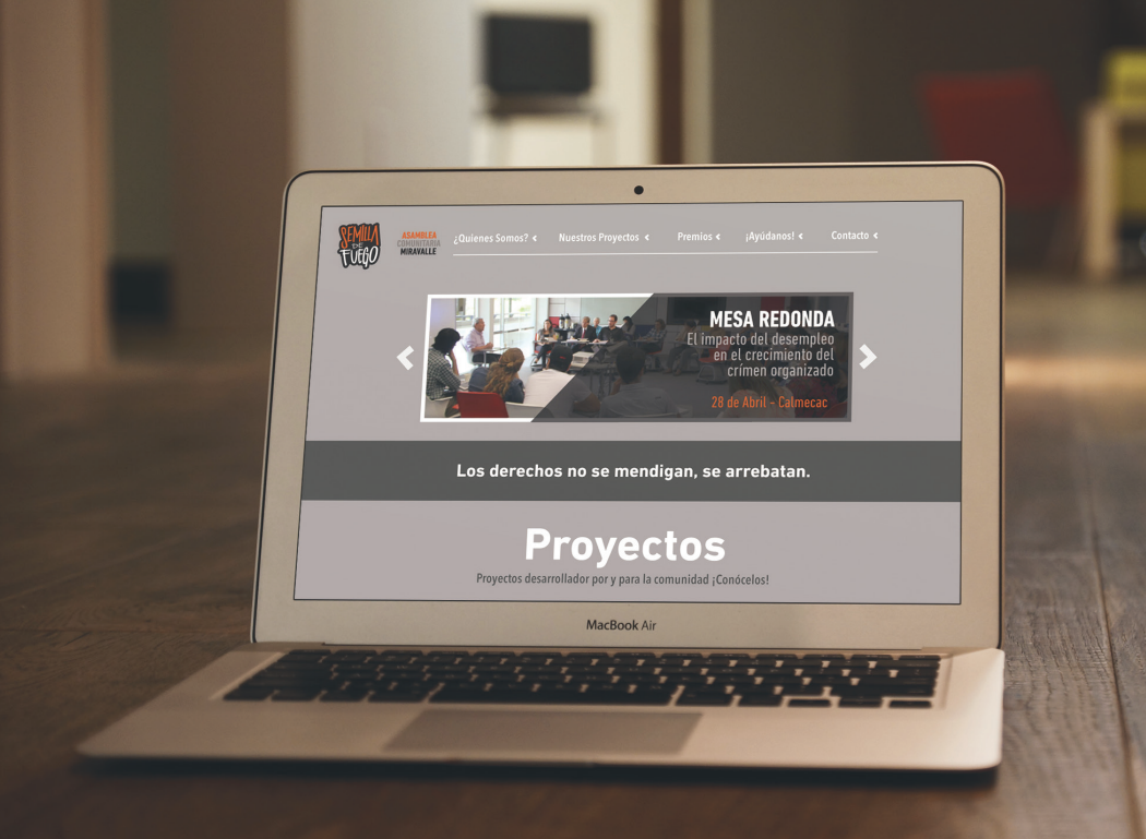
Página web Página de Facebook