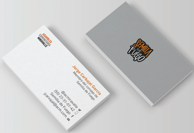
Tarjetas de presentación