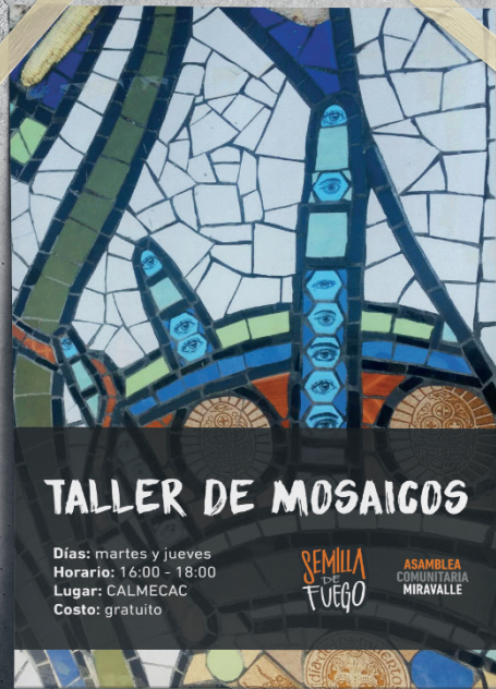
Cartel publicitario Volante