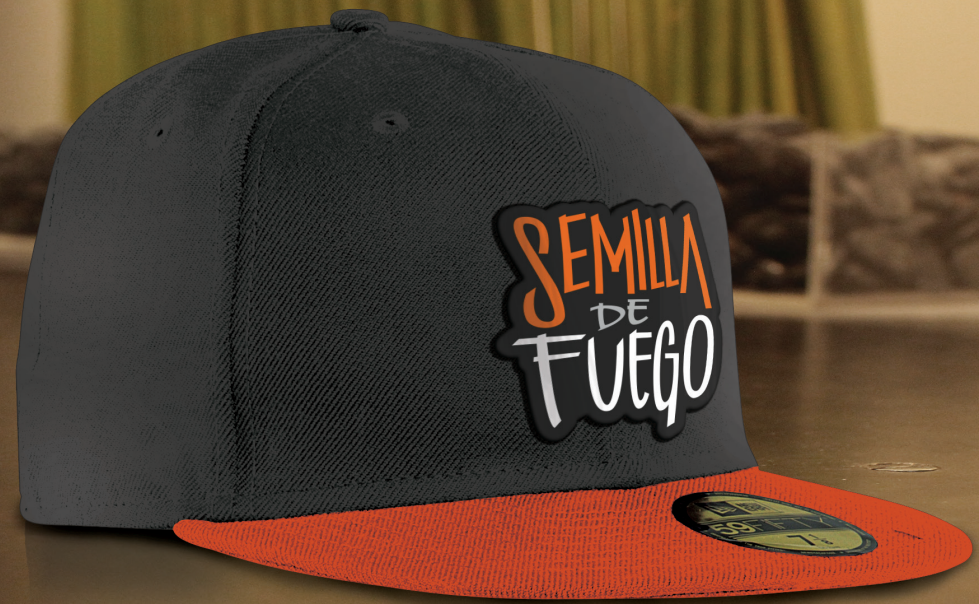
Gorra bordada Stencil