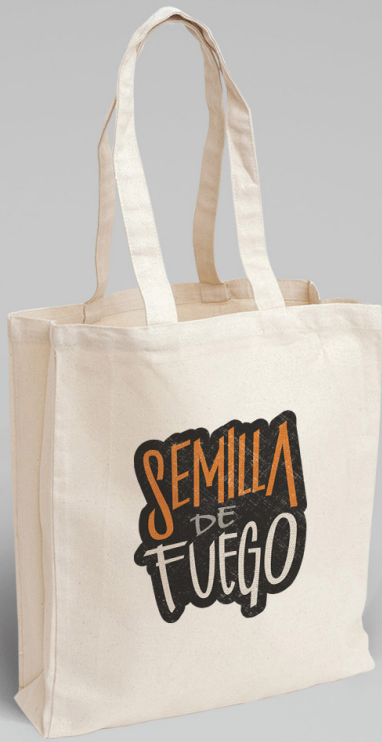
Bolsas de mercado