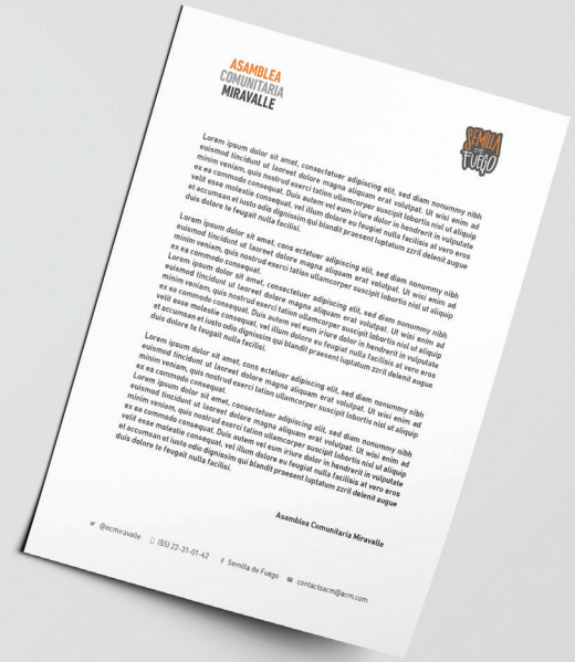
Hojas membretadas Pelota de frontón