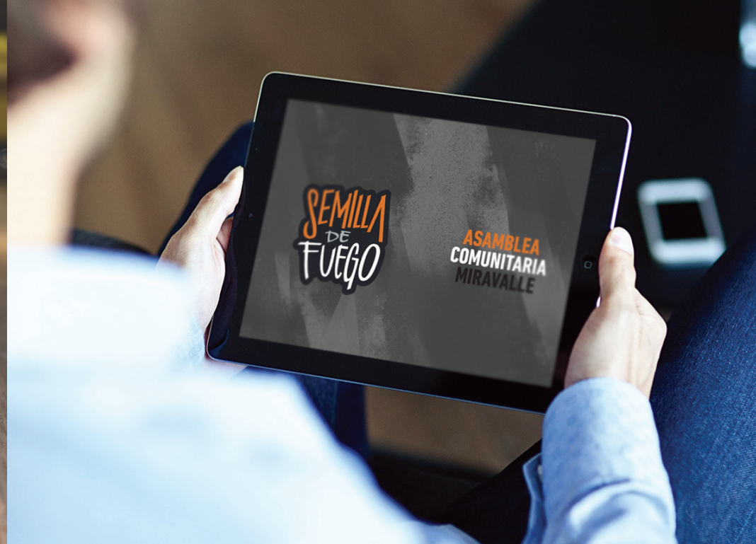
Cortinilla de video Stencil en negro