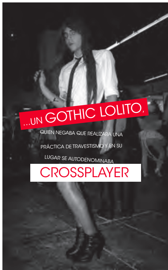
📷 Cosplay en el XVIII salón del manga de Barcelona en 2012.

gustos musicales, etc.). Para Urteaga, estas zonas transfronterizas no son transicionales y propone que las entendamos como porosas debido a su heterogeneidad, cambio rápido, movimiento y al prestar y pedir intercultural, no sólo encuentra que en ellas hay desigualdad, poder y dominación, sino producción cultural creativa.