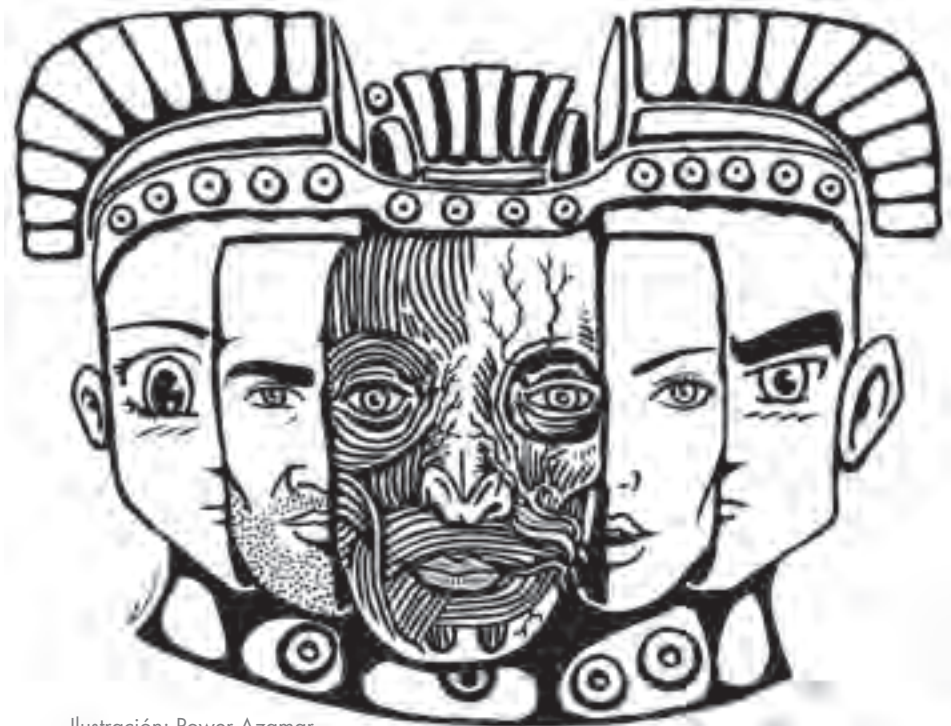
Ilustración: Power Azamar

No hay que dejar de lado la perspectiva de género y de diversidad sexual, pero tampoco designar y etiquetar ciertas prácticas de manera fácil y gratuita. Esta práctica emergente aún nos deja mucho por analizar en un mundo globalizado y mercantilizado.