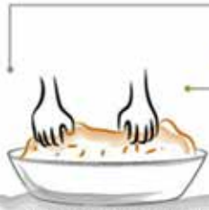
Ahora debe amasarse hasta que sea evidente el aceite en las manos.