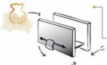
• Una vez envuelta la masa en la tela se coloca entre las placas de la prensa.