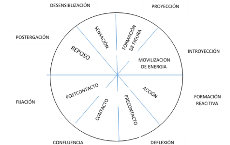
Fig. 1 Etapas del ciclo de la experiencia

En la Gestalt, para trabajar con las polaridades, bloqueos y conductas inadecuadas, se utilizan los experimentos que comprenden técnicas concretas para lograr que la persona pueda desarrollar conductas nuevas a través de la creatividad y alinearlas a una nueva concepción de sí mismo.