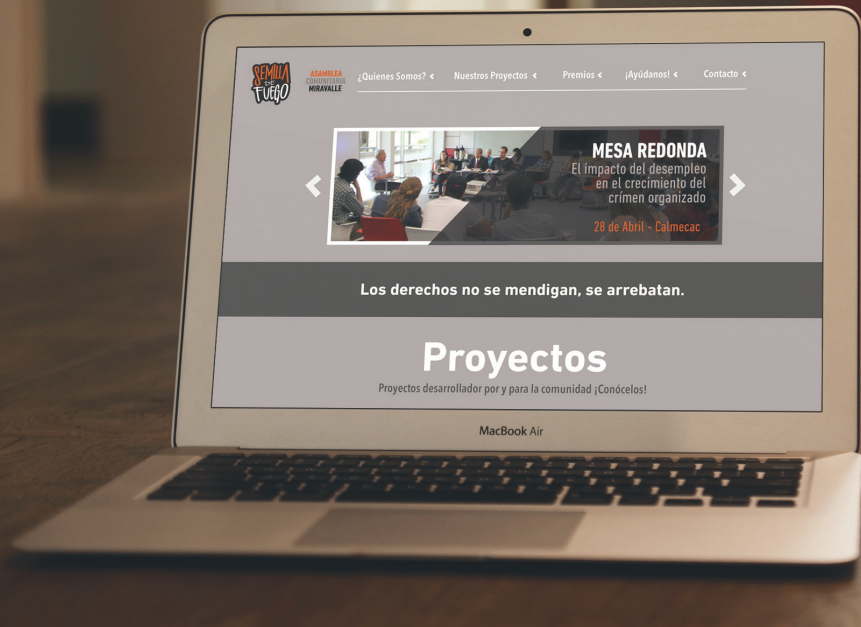
Página web Página de Facebook