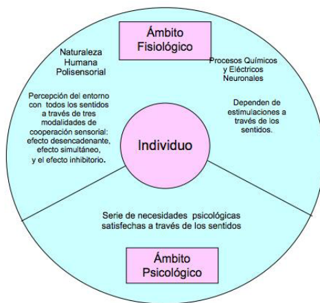
Figura 3. Diagrama que muestra los aspectos y la manera en que intervienen los sistemas sensoriales en el individuo