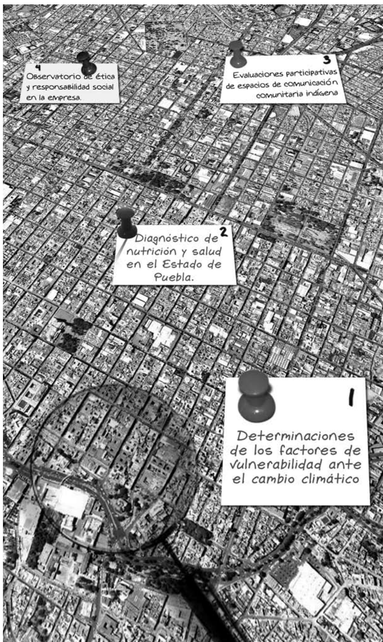
ilustración: B. Valero