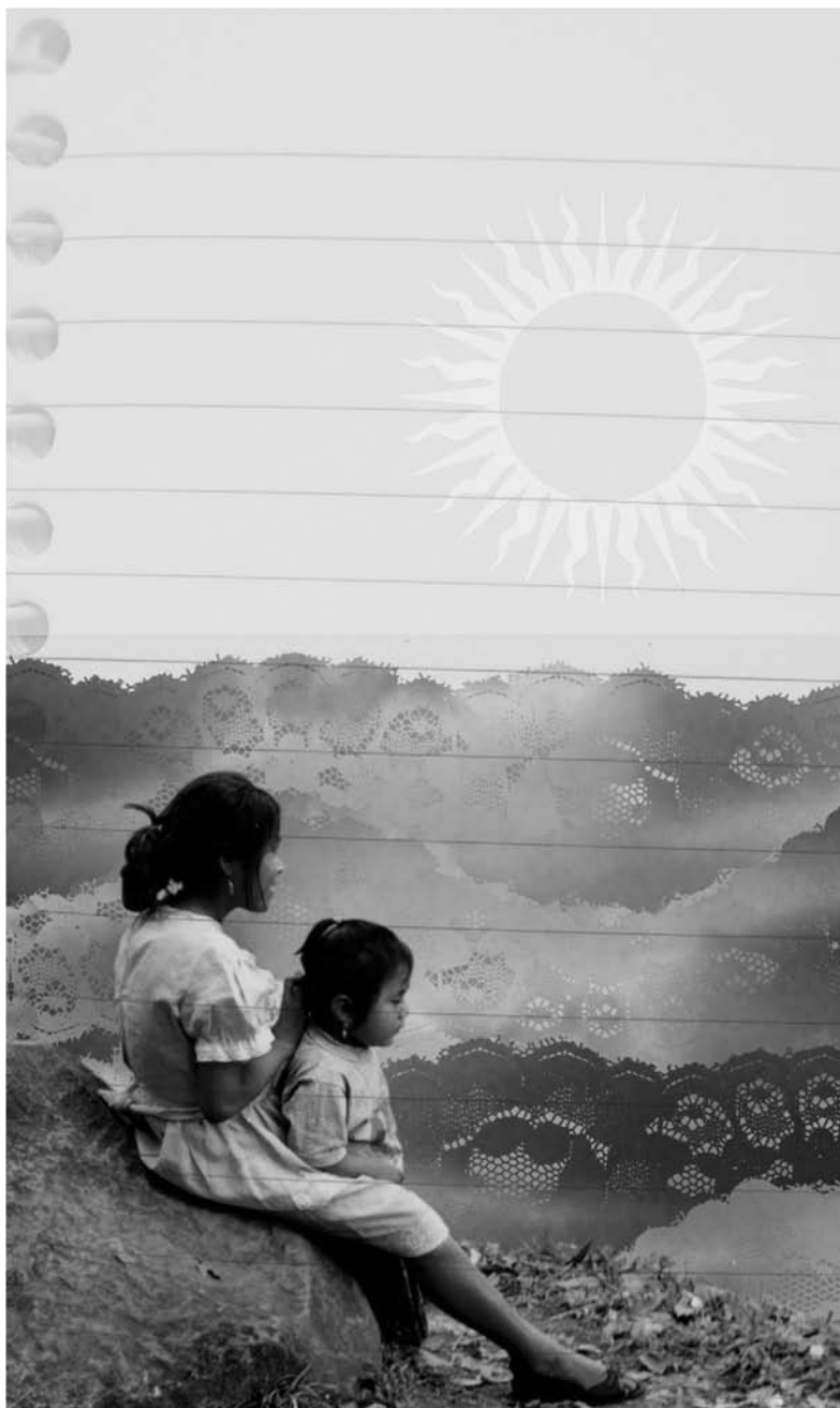
ilustración: B. Valerio