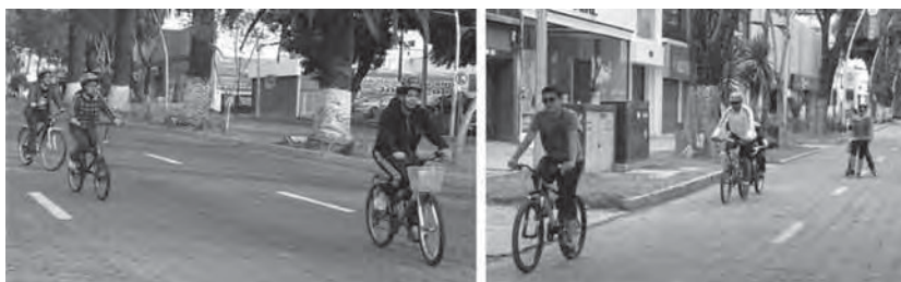
Fotos 4 y 5. Avenida Juárez: una de las vialidades principales del Centro Histórico donde se promueve disfrutar activamente los distintos espacios públicos en la zona a través de medios no motorizados como opción de transporte. Existe otro programa llamado “Paseo a ciegas”. Es una actividad para personas con capacidades diferentes, en la cual los paseos son guiados.

“La Gran Vía Recorre Puebla” es un Programa llevado a cabo cada domingo para realizar distintas actividades como: correr, trotar, caminar o andar en bicicleta en las principales avenidas del Centro Histórico de Puebla (Av. Juárez, 13 Sur, Av. Reforma, Av. Juan de Palafox y Mendoza, 4 Norte, 6 Oriente y 8 Norte).