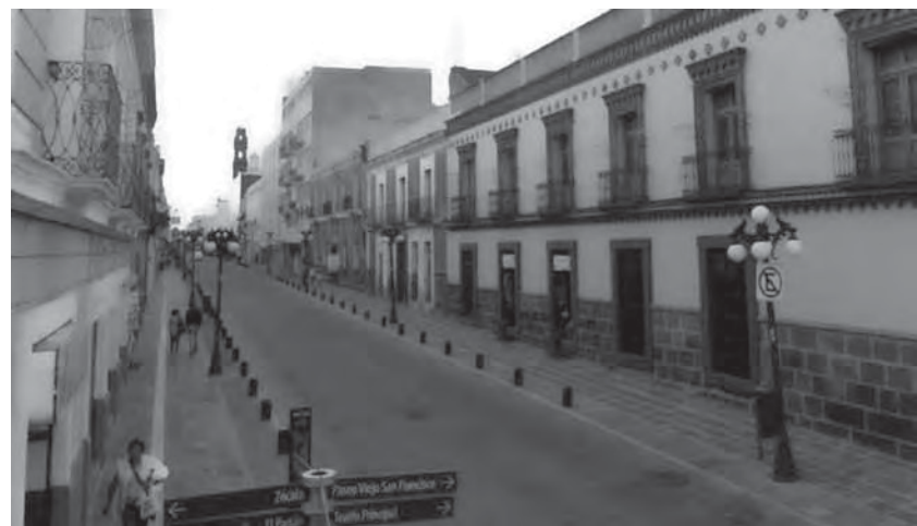
Foto 1. Calle Juan de Palafox y Mendoza: Ampliación de las banquetas dando preferencia al paso peatonal reduciendo el arroyo vehicular.

Se integran corredores peatonales a las áreas verdes, plazas, jardines, parques, etc. y éstos al sistema de transporte público, multiplicando así los sitios de encuentro, los cuales obtienen nuevos usos que los convierte en lugares de convivencia, recreación y actividad económica.