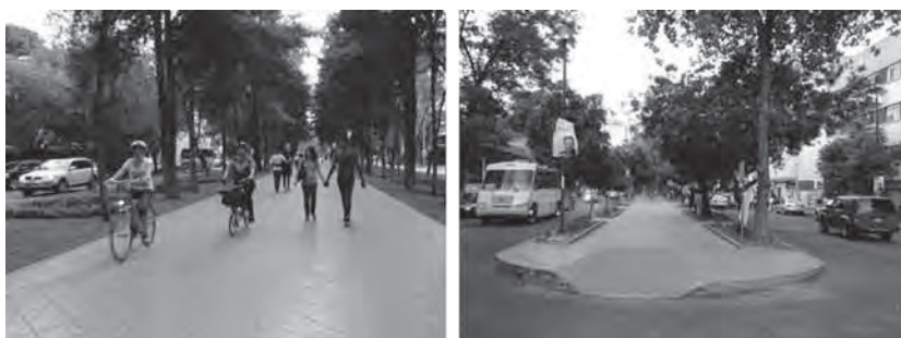
Fotos 6 y 7. Calle Horacio: se observa cómo a partir del aprovechamiento de los camellones se puede lograr que convivan los distintos modos de transporte, proporcionando seguridad a los usuarios. En ellos se ubican andadores peatonales protegidos por vegetación a los lados. Dichos andadores pueden ser utilizados para el paso de bicicletas, son acompañados además por bancas, fuentes y espacios para patinar.

En la ciudad de México, en los últimos quince años, las colonias Condesa y Polanco han experimentado modificaciones en su vida de barrio, presentándose cambios en su entorno y, sobre todo, en el valor del suelo, lo cual ofrece un estilo de vida atractivo por los comercios y servicios existentes, más para las poblaciones flotante y reciente, que para la población residente que vive ahí hace más de 20 o 30 años.