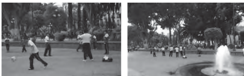
Fotos 2 y 3. Calle 3 Oriente: vialidad peatonalizada, donde se observan estudiantes de Secundaria jugando fútbol. Esta vialidad está ubicada entre la Catedral y el Palacio Municipal de Puebla y representa un ejemplo de apropiación e identificación a partir de evitar un flujo vehicular.