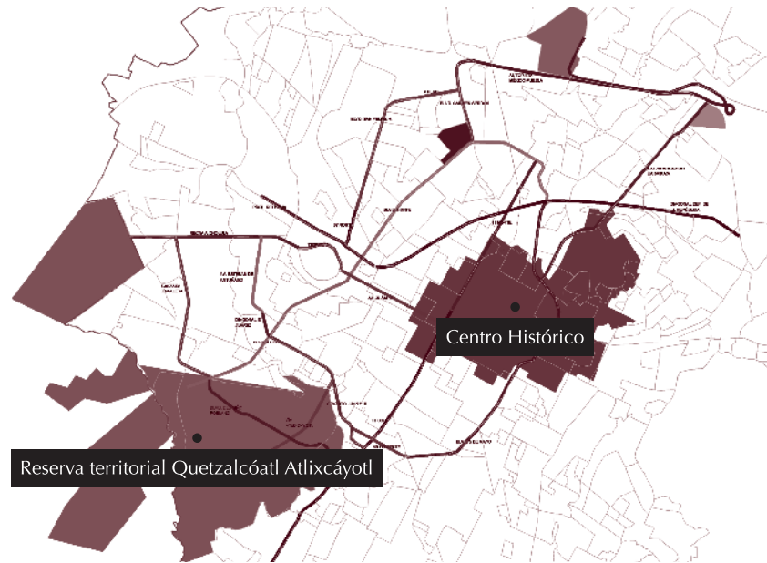
Figura 2. Ubicación de la Reserva Territorial Atlixcáyotl y ubicación del Centro Histórico.