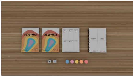
Imagen 3. Piezas 2. Elaboración Propia. (2023).

Ahora bien, la segunda parte consta de un objeto que funciona como altar, donde los jóvenes podrán guardar dentro del mismo, las actividades que se les dejaron de tarea para realizar en casa. El propósito del mismo es crear un ambiente seguro al igual que reforzar los vínculos afectivos con toda la familia, debido a que al estar en una situación donde hay un escenario en el que un padre puede trascender, el adolescente podrá generar memorias y momentos con su ser querido, al igual que tener tiempo de calidad.