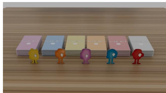
Imagen 2. Piezas 1. Elaboración Propia. (2023).

A su vez, el material contiene dos blocks, una de hojas de trabajo, otra para realizar los retos que proponen las cartas de retos, un instructivo, fichas de colores que se entregarán al terminar cada isla y un cristal donde se generará la dinámica final. De la misma forma, se implementa un manual para el terapeuta, o bien, para la persona que contenga en el espacio, con el fin de generar más dinámicas una vez finalizado.