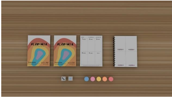
Imagen 3. Piezas 2. Elaboración Propia. (2023).

Ahora bien, la segunda parte consta de un objeto que funciona como altar, donde los jóvenes podrán guardar dentro del mismo, las actividades que se les dejaron de tarea para realizar en casa. El propósito del mismo es crear un ambiente seguro al igual que reforzar los vínculos afectivos con toda la familia, debido a que al estar en una situación donde hay un escenario en el que un padre puede trascender, el adolescente podrá generar memorias y momentos con su ser querido, al igual que tener tiempo de calidad.