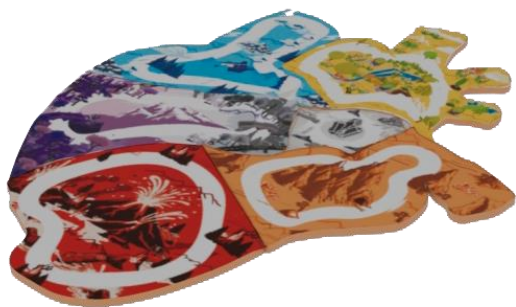
Imagen 1. Tablero. Elaboración Propia. (2023).

La propuesta de diseño se divide en dos partes importantes. El primero consiste en un tablero armable de 6 piezas, las cuales llamamos islas, donde cada una representa una etapa del duelo: negación, ira, depresión, negociación, aceptación; la sexta pieza funciona como una isla neutral, donde los participantes iniciarán al igual que finalizarán la dinámica.