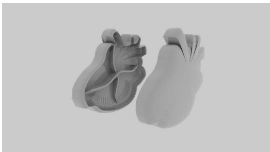
Imagen 4. Altar Render. Elaboración Propia (2023).

Ahora bien, la segunda parte consta de un objeto que funciona como altar, donde los jóvenes podrán guardar dentro del mismo, las actividades que se les dejaron de tarea para realizar en casa. El propósito del mismo es crear un ambiente seguro al igual que reforzar los vínculos afectivos con toda la familia, debido a que al estar en una situación donde hay un escenario en el que un padre puede trascender, el adolescente podrá generar memorias y momentos con su ser querido, al igual que tener tiempo de calidad.