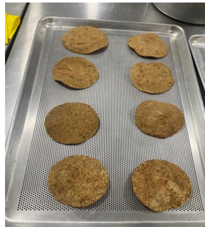
Fig. 1. Tostadas a base de harina de chapulín recién salidas del horno.