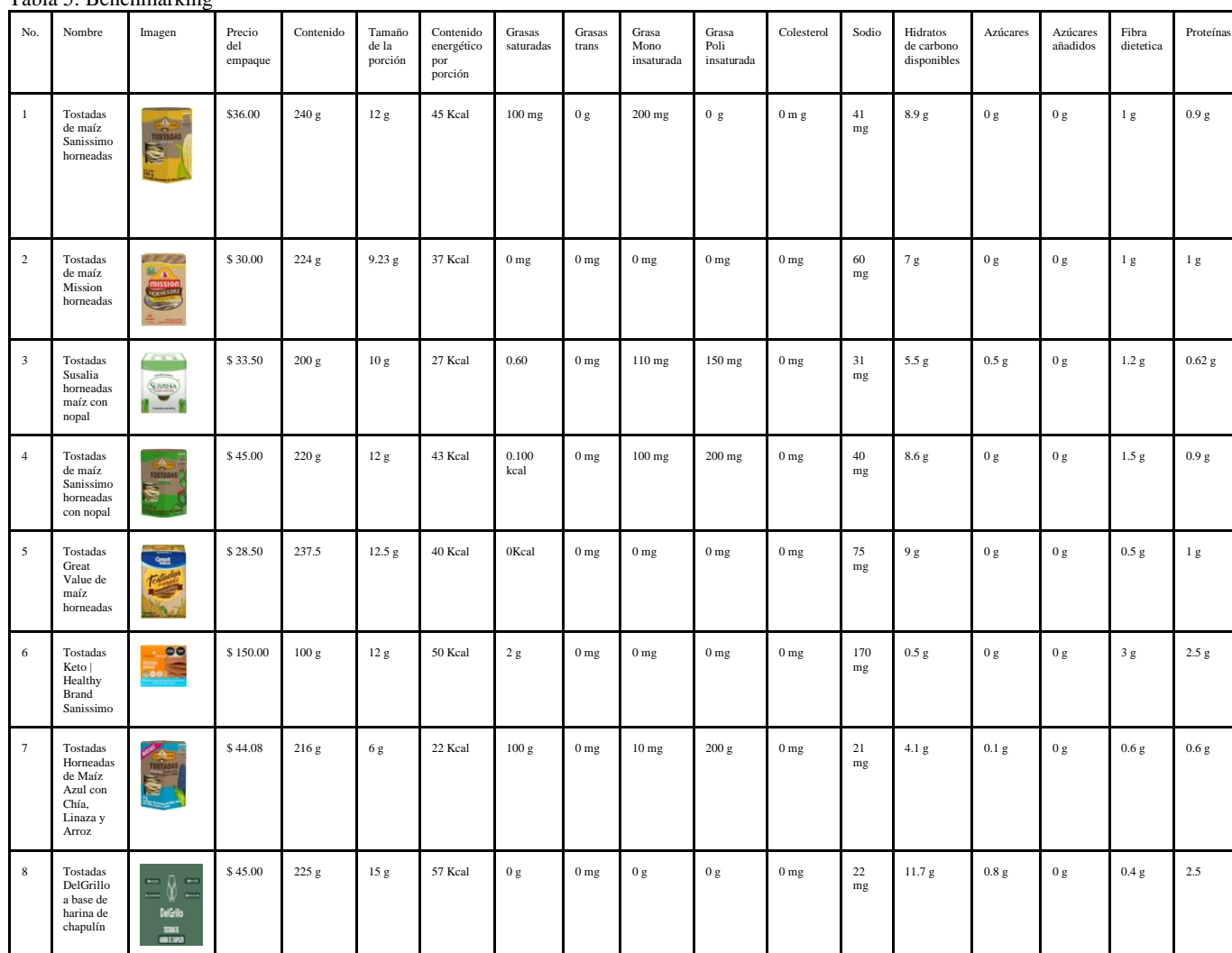
Tabla 5: Benchmarking

Al profundizar y comparar a los competidores de tostadas comerciales y saludables que hay en el mercado, este análisis permite visualizar con más detalle la cantidad de proteínas que tienen las tostadas DelGrillo a base de harina de chapulín en comparación a otras tostadas comerciales, de acuerdo a su gramaje por porción. Como conclusión, observamos que hay una diferencia menor de 1 g a 1.5 g en la cantidad de proteína por unidad en comparación con las tostadas DelGrillo, comprobando de esta forma que nuestras tostadas se diferencian y ofrecen la cantidad de proteína esperada. Además, DelGrillo ofrece un precio competitivo ante otras tostadas ofrecidas en el mercado.