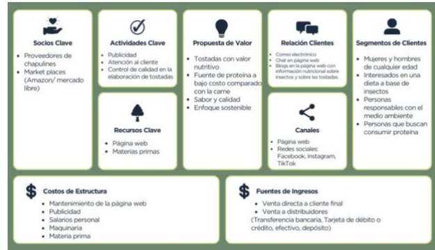
Fig. 4. Modelo Canvas Tostadas DelGrillo.

sostenibles a base de chapulín, inspirando un cambio significativo en los hábitos de consumo y promoviendo un estilo de vida más saludable y respetuoso con el planeta. Valores: Calidad, sostenibilidad, responsabilidad, impacto social, innovación y transparencia.