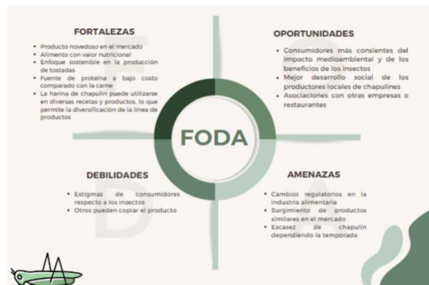
Fig. 5. Análisis FODA Tostadas DelGrillo.