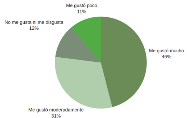
Fig. 3. Gráfica de Análisis sensorial.

Los datos obtenidos a través del análisis sensorial indicaron un promedio general (tomando en cuenta su textura, color y sabor) que al 46% de las personas les gustó mucho, al 31% les gustó moderadamente, al 12% no les gusta ni les disgusta, al 11% les gustó poco y por último al 0% le disgustó mucho (Fig. 3). Además, al 94% de las personas que realizaron nuestra encuesta les gustaría comprar nuestras tostadas. Los resultados fueron nuevamente positivos; sin embargo, se debe buscar una forma para mejorar el color de la tostada y que sea más atractiva visualmente para las personas.