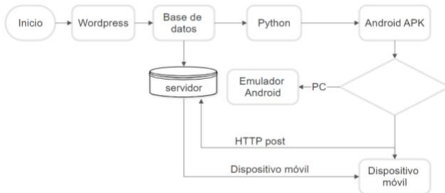
Fig. 1. Diagrama de bloques de la aplicación.

Módulos del sistema propuesto para la aplicación móvil, que trabajan juntos para crear una plataforma integral que facilita la gestión de excedentes alimenticios en pymes, fomentando la colaboración entre pymes o vendedores, y clientes o consumidores finales.