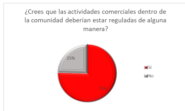
Fig 2: Personas que están de acuerdo que falta regularidad en el comercio en la universidad

También piensan que algunos productos no deberían ser comercializados, existe dificultad para llegar a los clientes y no hay suficiente distribución de los servicios o productos.