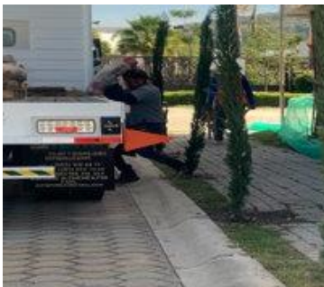
Fig. 4: Postura realizada por trabajador para el traslado y carga de material.

Dentro de las actividades observadas se logró identificar que algunos de los trabajadores hacían uso de fajas para lograr equilibrar el peso que cargaban, siendo esta una medida de seguridad efectiva para contrarrestar los efectos de un mal trabajo, pero había otros trabajadores que realizaban la carga física constante sin este equipo de seguridad. En la Fig. 4 se observa la actividad de carga que realiza un trabajador con un costal de cal, este siendo llevado a un vehículo para su transporte, algo a considerar en esta imagen es la postura que ocupó el trabajador para acomodar el costal, esta sin uso de una faja para su apoyo en la columna vertebral que evitase un daño en esta.