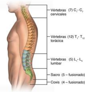
Fig. 3: Anatomía ósea de la espalda donde se observa la columna vertebral [14].

Los huesos que conforman la estructura de la espalda desempeñan la función principal de proporcionar soporte, constituyendo lo que conocemos como la columna vertebral. La columna vertebral está compuesta por vértebras que se encuentran unidas por discos esponjosos, esenciales para prevenir la fricción entre los huesos y permitir la flexibilidad necesaria para los movimientos cotidianos [14]. En la Fig. 3 se puede observar las vértebras que conforman la columna vertebral.