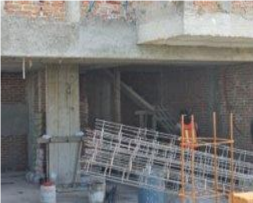
Fig. 1: Entrada principal de la obra de casa-habitación ubicada en Lomas de Angelópolis sección 3.