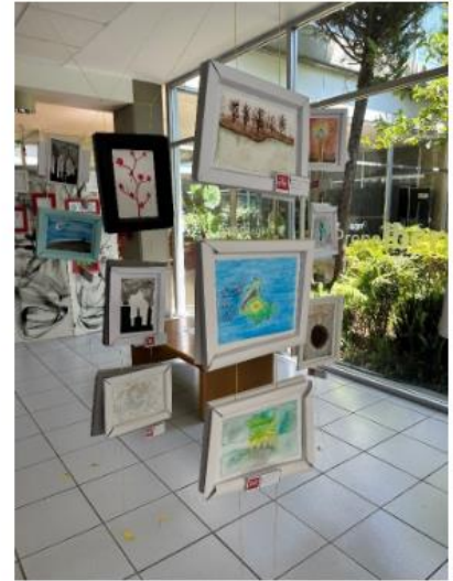
Representa todo el apoyo que hay detrás de todos nuestros trabajos

Para mi yo siento que es la luz ya que siento que los profes siempre te están orientando