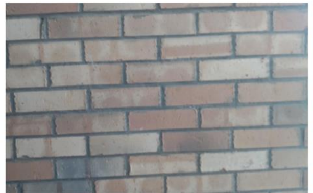
Organizado/ lleva un orden: Es muy importante tener una buena organización al momento de explicar un tema para que los receptores puedan captar mejor la información que se les está dando

Yo elegí tomarle foto a estas escaleras ya que representan el crecimiento y desarrollo durante la escuela gracias a los profesores. Los espacios largos significan los obstáculos como discusiones o peleas con los profesores, pero como podemos observar siempre vuelve a haber escalones, pues los profesores siempre están ahí para apoyarnos, guiarnos y ayudarnos a tener una buena formación para la vida futura