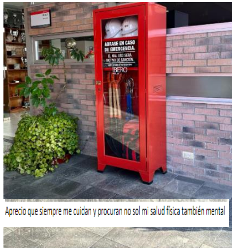
Aprecio que siempre me cuidan y procuran no sol mi salud física también mental