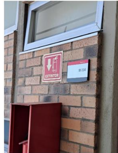
Un docente debe de estar informado y bien preparado