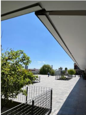
Representa la cualidad de mente despejada, escogí un espacio abierto haciendo representación a la mente despejada de un docente, incluye tranquilidad, felicidad y pensar positivo