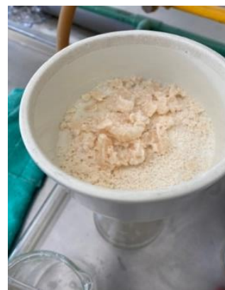
Fig.4: Producto resultante en solución acuosa de cloruro de sodio y agua. Elaboración propia (2023).

La discusión por mantener el hidróxido de sodio y el hidróxido de potasio se tornó compleja, debido a que ambos presentaban mismas propiedades e inclusive mismos resultados, sin embargo con el paso de los rendimientos del jabón que se observaba conforme pasaban los días, tras realizar un lavado de los jabones normales, se observó que los jabones realizados con el hidróxido de sodio marcaba mayor sustentabilidad, mientras que en los de hidróxido de potasio se observó menor sustentabilidad, sin embargo el hidróxido de sodio se acercaba a la viscosidad del jabón y hacerlo más eficaz en los motores automotrices con un menor proceso de aplicación, el hecho fue que como objetivo se buscaba un mayor proceso de eficacia y aplicación para los motores automotrices, en este caso fue tomada la decisión de mantener el producto original que es el hidróxido de sodio y se realizó distintas pruebas para lograr el objetivo de que fuera aplicable en los motores automotrices.