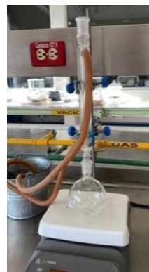
Fig. 1: Sistema de reflujo utilizado para el proceso de saponificación. Elaboración propia (2023).

El aceite filtrado fue utilizado en el proceso de saponificación; para realizar el procedimiento se utilizó el índice de saponificación para conocer la cantidad necesaria de materia necesaria para el proceso. Para este proceso se utilizaron 5 gramos de aceite por cada 5 gramos de NaOH utilizado. El proceso consistió en: un vaso de precipitado de 100 ml se pesaron 5 g de NaOH y disolvieron en 10 ml de agua destilada. El vaso se colocó sobre la parrilla para su disolución completa, usando un agitador magnético.