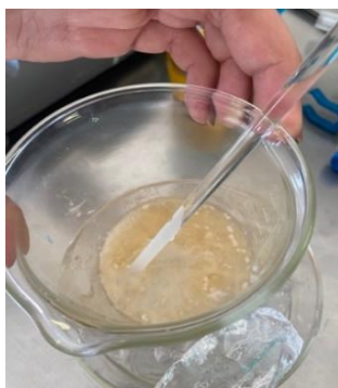
Fig.3: Jabón resultante del proceso después del filtrado al vacío. Elaboración propia (2023).

Una vez que se formó el jabón y se separó el residuo, se filtra a través de vacío, se enjuaga con el agua fría que se puso a enfriar, con la finalidad de quitar el exceso de hidróxido de sodio.