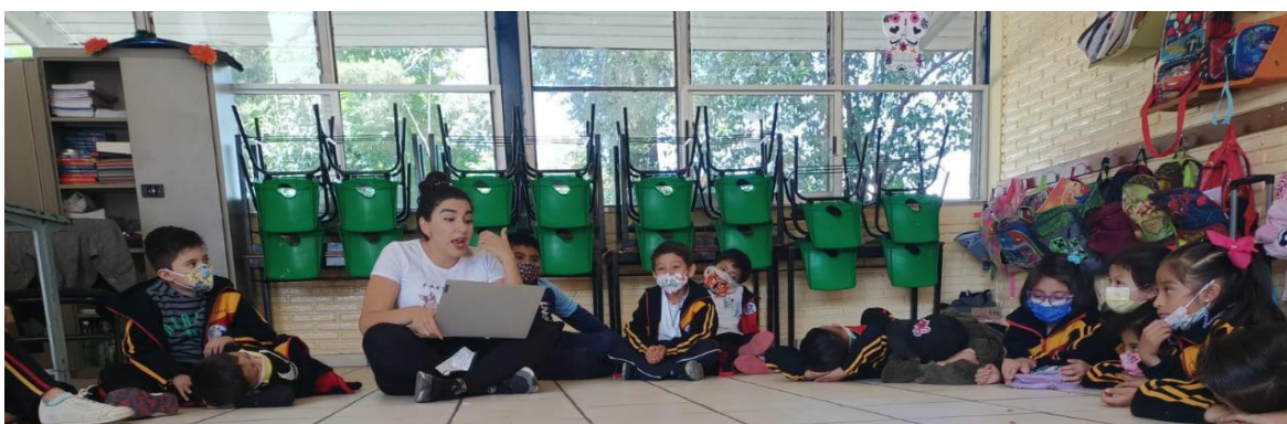
Ilustración 11. Lectura de cuento "Chispa Brava"

Interacción: Se mostraron participativos y atentos, les agradó la historia, esta clase se interrumpió por la clase de educación física, por lo cual se tuvo que retomar al día siguiente, habían perdido un poco la atención que se había logrado en un primero momento, sin embargo, fluyo de manera que les permitió llegar a las conclusiones esperadas. Las cuales fueron: no hacer caso cuando me quieren hacer enfadar, si hace daño no lo hago, mis emociones son importantes, pero debo saber controlarlas.