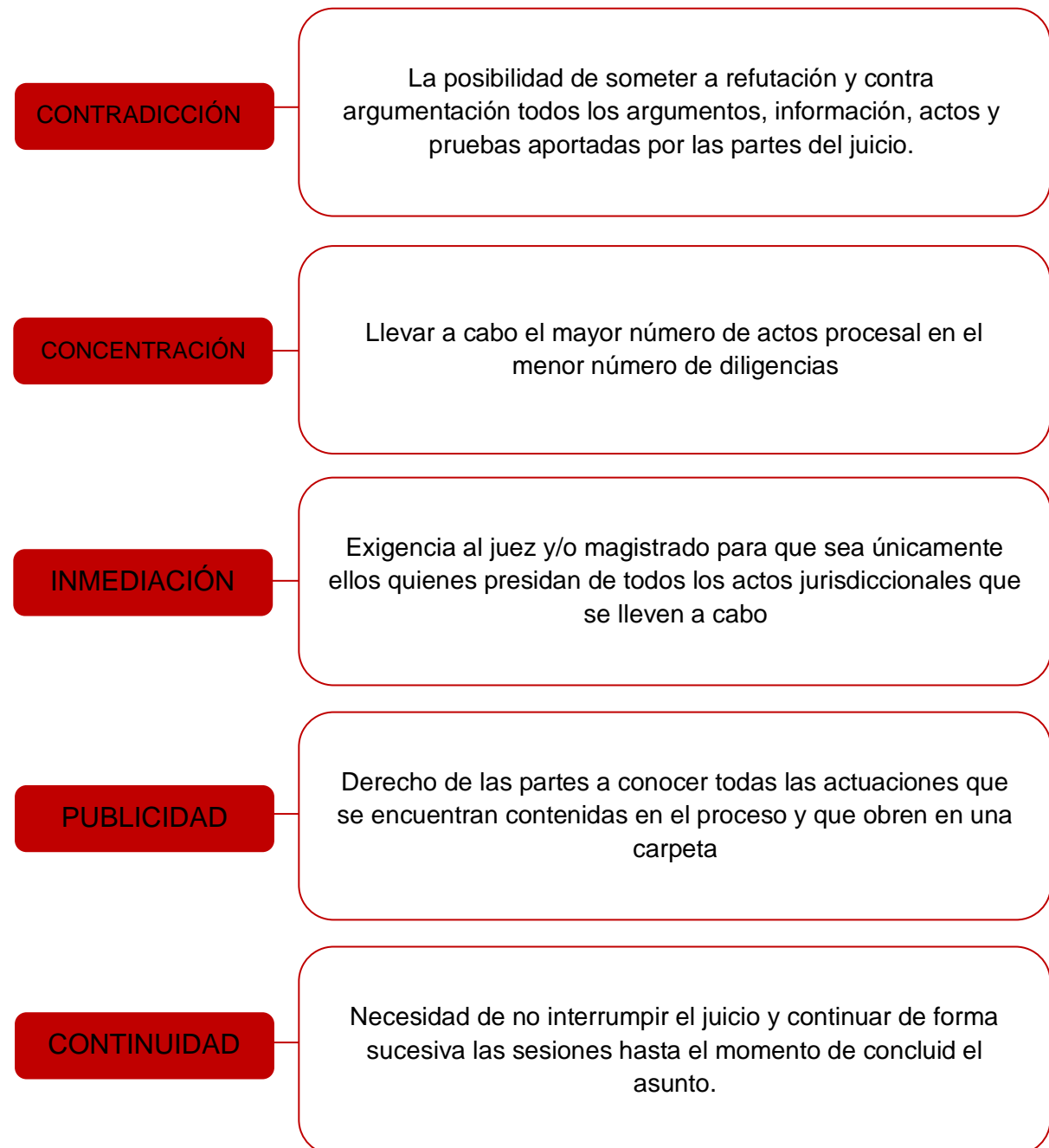
(Diagrama 1.) 13

Los principios permiten dotar de credibilidad a la institución judicial, mismos que se enuncian en la Constitución y fueron considerados un aspecto medular en la reforma de 2008. Dichos principios son tan importantes que son el pilar del juicio acusatorio oral y se encuentran aún ubicados en el artículo 20 de la Constitución Política de los Estados Unidos Mexicanos.