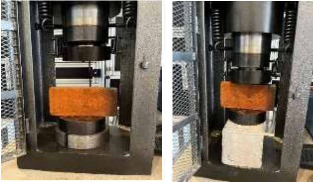
Fig. 1: Posición del ladrillo en la prensa hidráulica.

se registra el dato obtenido en una tabla y se compara con lo que determina la norma mexicana.