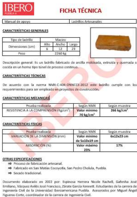
Fig. 5: Ficha técnica de los ladrillos de San Matías Cocoyotla.