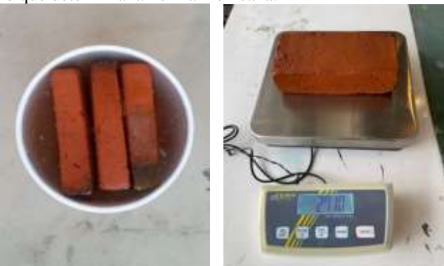
Fig. 2: Absorción total de los ladrillos.

Se registra el dato obtenido en una tabla y se compara con lo que determina la norma mexicana.