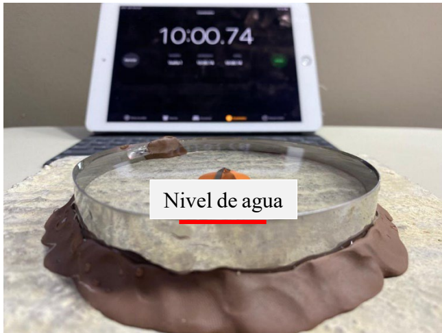
Figura 2. Prueba de permeabilidad en placa de concreto. La imagen nos muestra el término de la prueba en la que podemos observar que el nivel del agua se mantuvo hasta el tope del cono.

La mezcla de 850 ml de nejayote, 60 gr de mucílago de nopal, 50 gr de alumbre y 40 gr de jabón se aplicó sobre una placa de concreto misma que se sometió a una prueba de permeabilidad como se muestra en la figura 1.