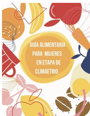
Figura 1. Portada de la guía alimentaria

El grupo final de estudio estuvo conformado por 16 mujeres, con un rango de edad de 41 a 59 años, de nacionalidad mexicana y de nivel socioeconómico medio, las cuales respondieron un formulario inicial y final. Se establecieron dos sesiones de seguimiento donde se resolvieron dudas sobre la guía alimentaria y se recabaron resultados cualitativos.