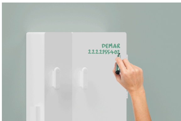
Imagen 3. Render. Autoría propia.

exterior del gabinete es un pizarrón para establecer recordatorios, además incluye cinco tramos de pizarrón blanco para pegar en diferentes secciones de la casa y mantener una comunicación continua de pendientes y observaciones, tanto para el cuidador como para el adulto mayor en la etapa inicial de la enfermedad.