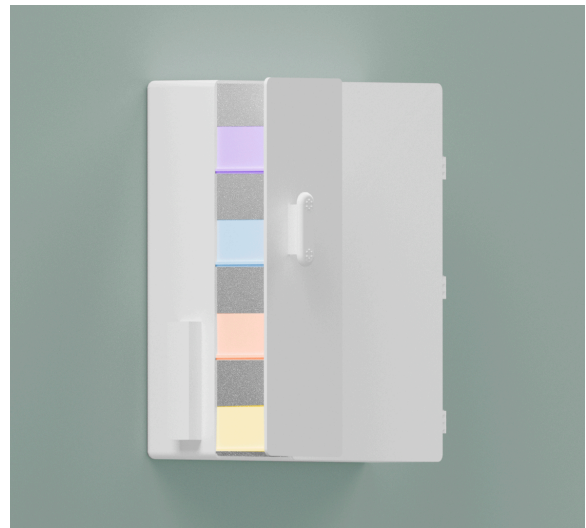
Imagen 2. Primer prototipo.