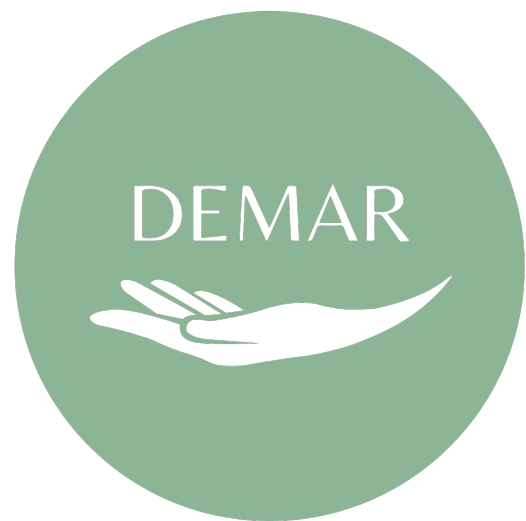
Imagen 6. Identidad. Autoría propia.

cursos, consejos o interacción en foros son bastante atractivas. Además, reconocieron la eficiencia del modelo para organizar los medicamentos, pues fue evidente la mejora en la rutina de tomar medicamentos recetados con un horario específico. Al tener todo a su disposición, optimizaron procesos que antes consideraban demasiado tediosos o complicados de cumplir en tiempo y forma.