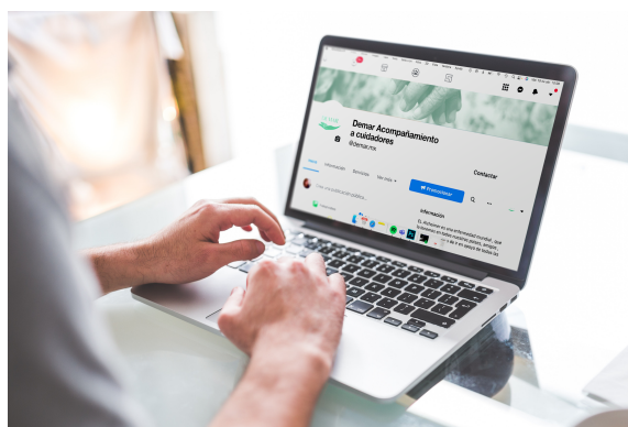
Imagen 4. Página facebook.

La vejez suele ser estigmatizada por la sociedad. De acuerdo con el sociólogo Erving Goffman, la concepción de los adultos mayores construida por parámetros de imagen, rol y figura social, en su mayoría no son positivos (Federación Iberoamericana de Asociaciones de Personas Adultas Mayores, 2014, párr.3). Por lo tanto, al atender una problemática que involucra a este sector, es imprescindible contemplar postulados que