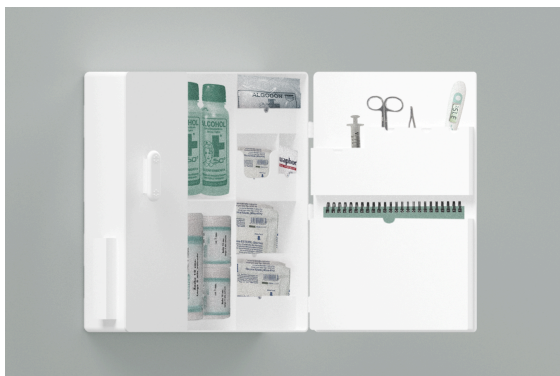
Imagen 1. Render. Autoría propia.

A diferencia de otros apoyos para nuestro usuario, esta propuesta busca generar un espacio ordenado y amigable para el cuidador primerizo, además de proporcionar guías gráficas con información concisa sobre manejos durante el progreso de la enfermedad. Es estas características radica el valor de la propuesta.