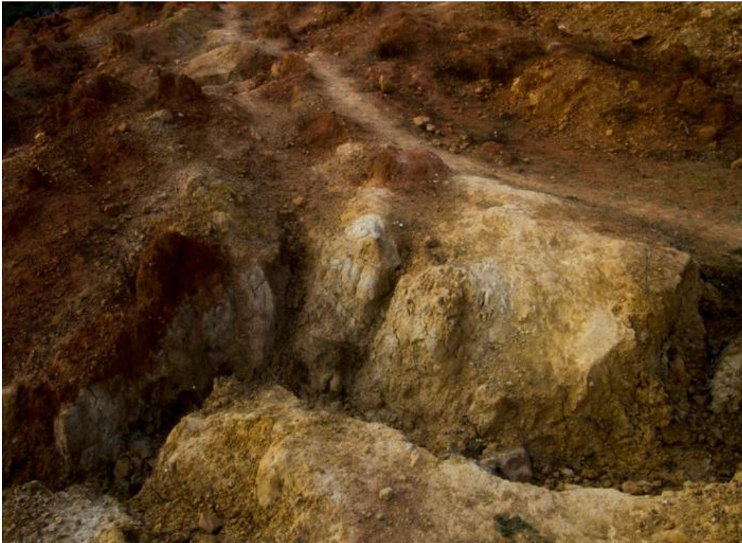
Imagen 4 Karina Juárez. "9 mil kilómetros". s/f.

9 mil kilómetros (s/f), de Karina Juárez.