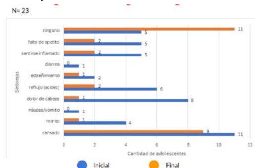
Figura 2. Sintomatología inicial y final de la población

Las frecuencias de consumo alteradas (verduras, frutas, grasa saturada y azúcares) mejoraron.