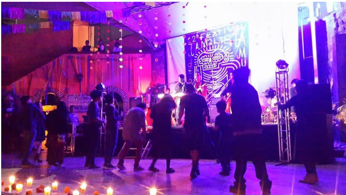
Imagen 1. La fiesta Tamalista. Niños, niñas, jóvenes y adultos bailando juntos. Fotografía recuperada del trabajo de campo. Barrio del Alto, Puebla, 2018.