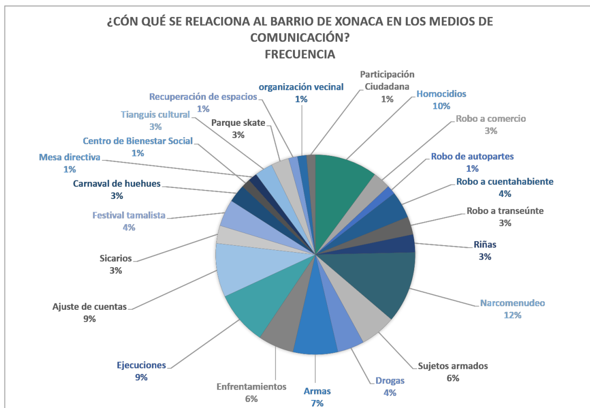
Tabla 8. Frecuencia de temas con los que se relaciona al barrio. Elaboración propia.

¿Cómo se adhieren esos imaginarios a los territorios y a los sujetos que los habitan? En un ejercicio que incluyó a 5 mujeres y 5 hombres de entre 21 y 40 años de edad, en torno a la pregunta ¿Cuáles consideras que son los lugares más inseguros de la ciudad de Puebla? Los resultados fueron: La María, La Calera, El barrio de Xonaca, Agua Santa, el centro, Cruz del Sur, La Margarita y Bosques de San Sebastián. Al preguntarles si alguna vez habían ido al barrio de Xonaca o sabían dónde estaba, sólo una mujer respondió haberlo visitado en algún momento de su vida. Al preguntarles por qué lo consideraban peligroso, las respuestas versaban entre “por lo que dicen que pasa ahí”, “por las noticias”, “porque me dijeron que ahí era peligroso” y “dicen que ahí matan”. Ninguno había tenido alguna experiencia directa de violencia o delincuencia con el barrio.