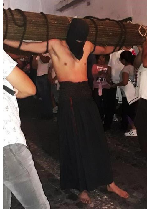
Imagen 2. Encruzado de Taxco Guerrero.

Con estos y otros atractivos, Taxco se colocó como uno de los destinos predilectos para los turistas y, eventualmente, fue colocado dentro de la denominación de “Pueblo Mágico 2 ”, con todo lo que esto implica. La oferta hotelera y restaurantera tuvo que ampliarse. Hoteles y restaurantes empezaron a brotar como alpiste en tierra húmeda. Eventualmente llegaron los Oxxo, un bodega Aurrera y un Chedraui, convirtiéndose rápidamente en la fuente principal de empleo para los más jóvenes, sobre todo para los que su nivel de estudios se quedó en secundaria o prepa.