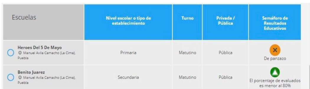
Figura 11. Resultados prueba ENLACE

En el año 2017, los estudiantes de la primaria de la comunidad tuvieron un resultado igual al “de panzazo” (ver figura 11). A diferencia de este resultado, la secundaria obtuvo el indicador de “excelente”, aunque el porcentaje de los estudiantes evaluados es menor al 80% del total.