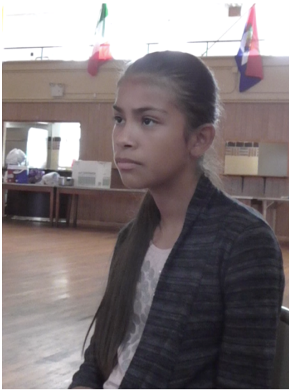
Imagen 15. Dalia.