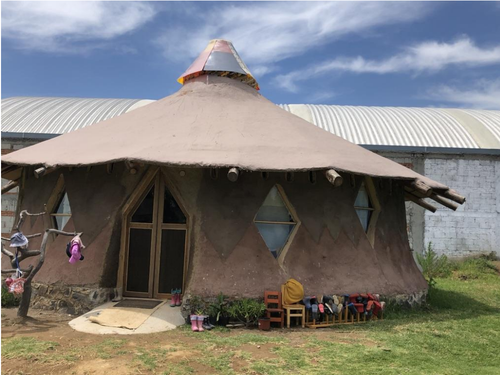
Foto: La Yurta. Un salón en Santa María Tonantzintla, construido de manera colectiva por la comunidad de los padres y los y las maestro/as de la Escuela Raíces para sus niños y niñas. Elaboración propia.

manera en la que nos relacionamos con el entorno y con nosotras y nosotros mismos. Las escuelas pueden perpetuar las dinámicas de fragmentación que imperan en la ciudad, o bien pueden ser espacios de la construcción del tejido comunitario que pone el cuidado y la reproducción de la vida en el centro.