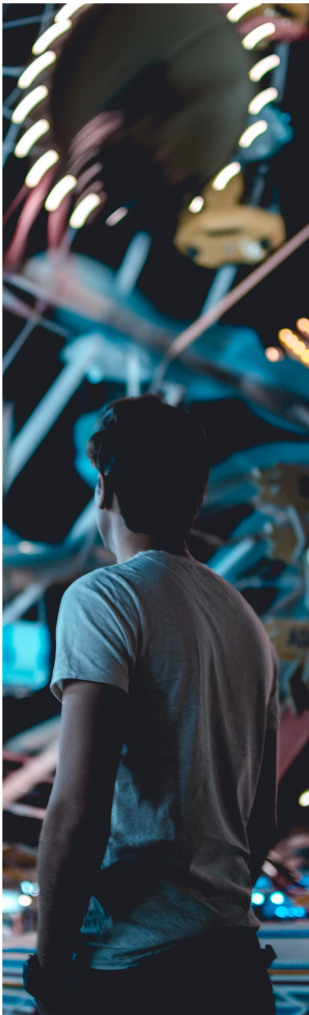
TABLA DE contenidos