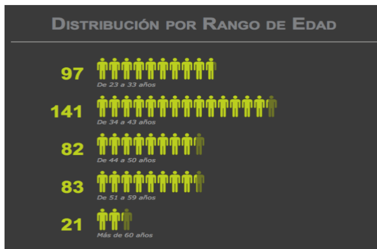
Figura 1. Distribución por edades, elaboración propia a partir de datos proporcionados por Dirección de Personal

Los datos proporcionados por la Dirección de Personal mencionan que en 2016 contaba con una plantilla de 424 colaboradores, de los cuales 281 son administrativos y 143 académicos, el rango de edades oscila entre los 23 y 81 años y 110 colaboradores son mayores de 50 años. Ese grueso de población se encontrará, en 15 años, viviendo un proceso de jubilación.