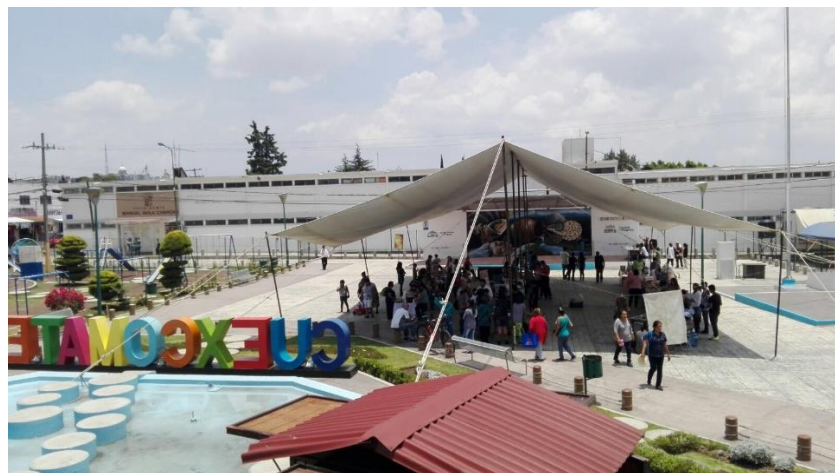
Fotografía 3. Feria de Economía Social y Disco Sopa en la colonia La Libertad. (García,2017)