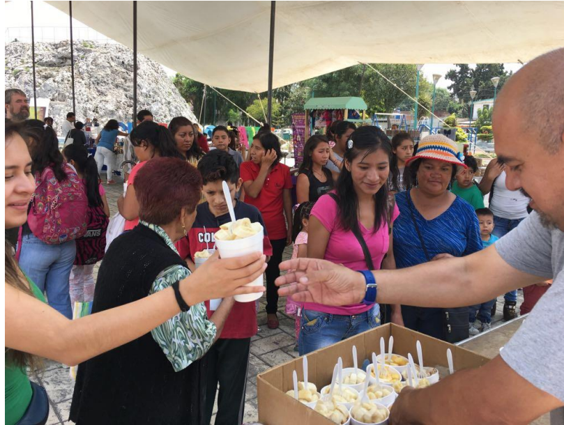
Fotografía 2. Feria de economía social y disco sopa colonia La Libertad. (García,2017)

en el caso de las empresas de las zonas Centro y San Baltazar, lo cual fue muy significativo pues uno de los grandes retos del proyecto era lograr la autogestión de los grupos.