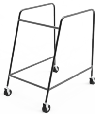
Figura 3. Render Chanau. Elaboración propia.

La estructura de Chanau esta elaborada con tubos de hierro de calibre 18 de 3/4 de pulgada. En total, para su elaboración, se emplearon 6 metros de tubo.