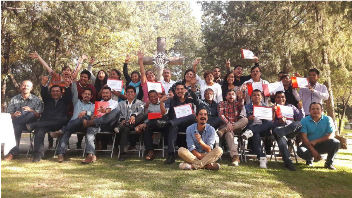
Figura 3. Foto del cierre de la formación de Orientadores de Empresas de Economía Social de Michoacán y Guerrero.

Como parte de los aprendizajes obtenidos desde la experiencia de los orientadores, a partir de lo visto en la última semana de formación, podemos mencionar los siguientes: