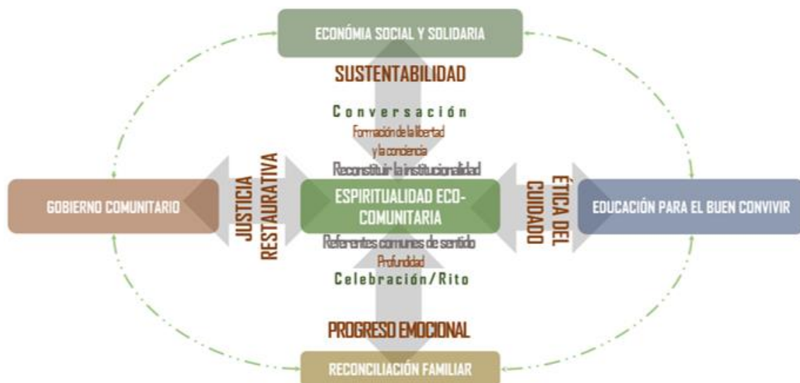
Figura 2. Propuesta para la Reconstrucción del Tejido Social del CIAS