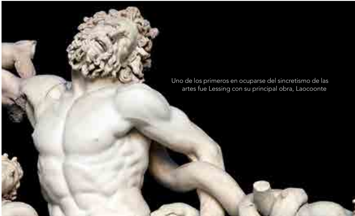
Uno de los primeros en ocuparse del sincretismo de las artes fue Lessing con su principal obra, Laocoonte

caradamente por la misma proposición cultural. El arte y su característica ficcional será tema en boga por el cual tanto la literatura, la pintura y todas las denominadas “artes” puedan entablar una abierta conversación con el hombre y su manera de proceder en su existencia.