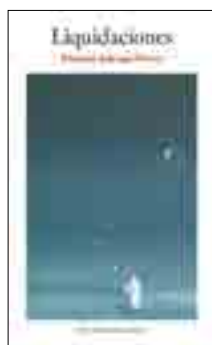
Eduardo Sabugal. Liquidaciones . México: Fondo Editorial Tierra Adentro

B) De interacción cooperativa. Se deben buscar más formas de interactuar entre los participantes. La llamada "tutoría entre iguales", así como la interacción cooperativa entre los participantes, puede ser una buena base para la creación de ZDP. Las características de este tipo de actividades interactivas incluyen el contraste entre puntos de vista moderadamente divergentes a propósito de un contenido conjunto.