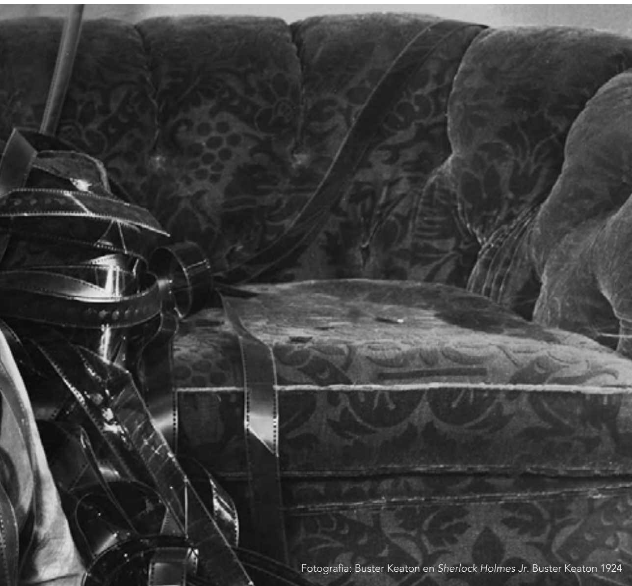
Fotografía: Buster Keaton en Sherlock Holmes Jr. Buster Keaton 1924