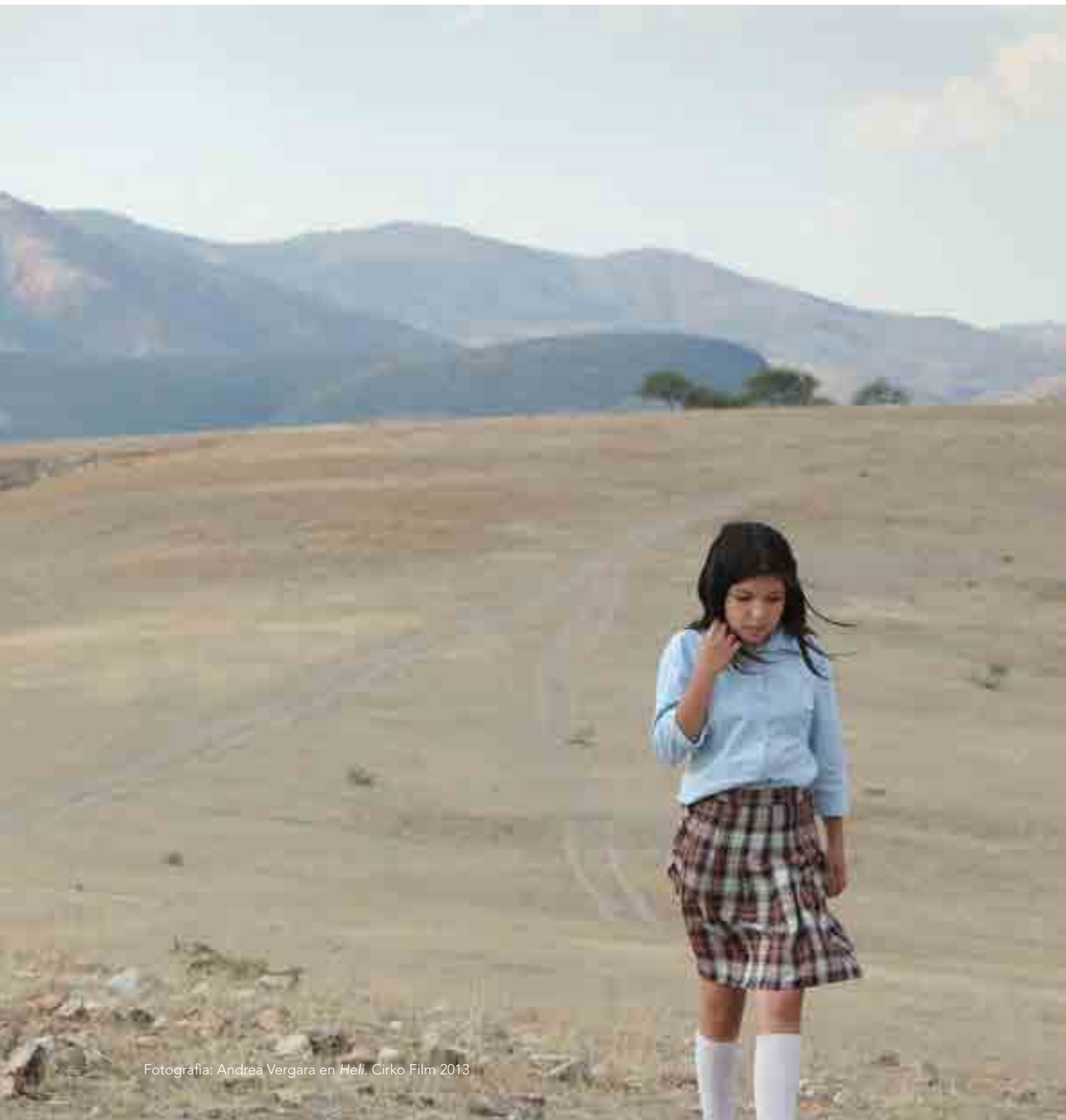
Fotografía: Andrea Vergara en Heli . Cirko Film 2013