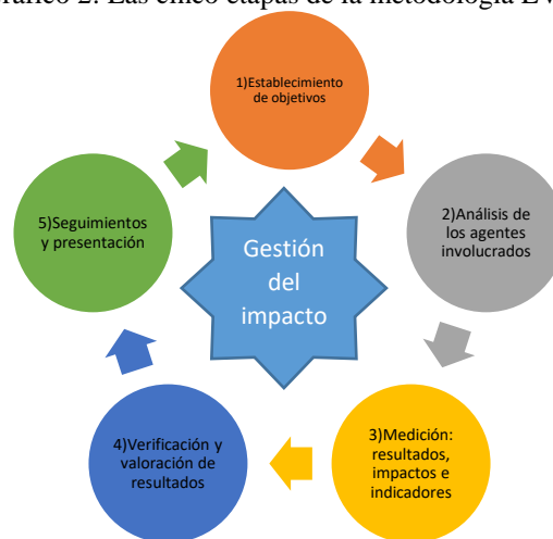
Gráfico 2: Las cinco etapas de la metodología EVPA