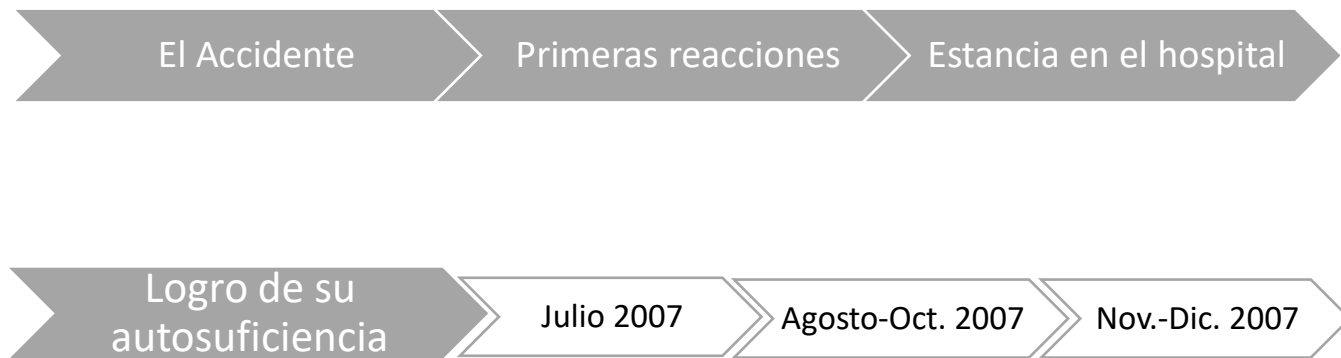
Imagen 1: Línea del tiempo

A continuación, se describen las situaciones vividas durante el accidente, en una línea del tiempo de este caso, para entrelazarlo con los aspectos teóricos mencionados: